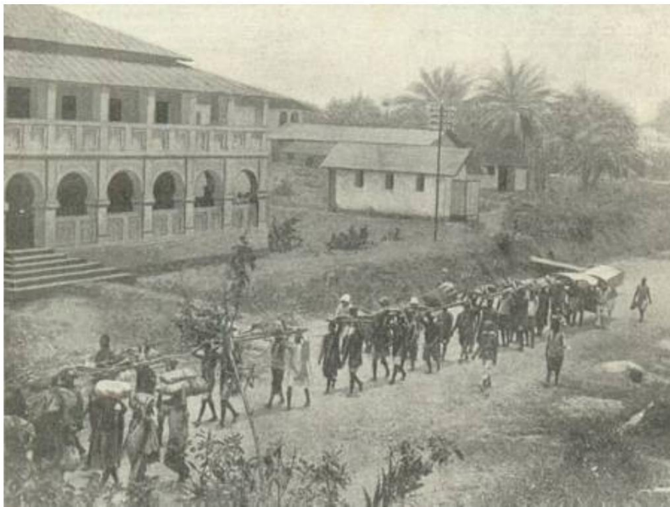
Les porteurs indigènes transportent des blessés, Cameroun 10 ), env. 1915.

Hormis une section de 10 munitions motorisées, le corps expéditionnaire n'apporte aucun matériel roulant. Au lieu de cela, un Indian Coolie Corps de 508 porteurs a été utilisé, en plus d'un nombre important, mais inconnu, de porteurs africains recrutés à Mombasa.