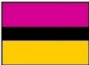
Korpsfarver : Corps médical de l'armée indienne. De Source 3.

A partir de 1944 (Source 3), l'Indian Army Medical Corps adopte les couleurs rouge cerise (cerise terne), noir (noir) et doré (vieux or) et les couleurs sont poursuivies par l'Army Medical Service, avec la symbolique suivante :