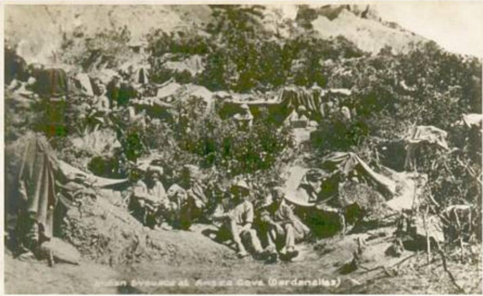
Bivouacs indiens à Anzac Cove (Dardanelles), 1915.