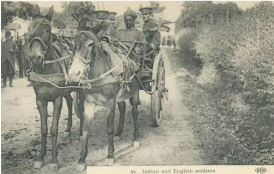
Mule Cart (AT Cart), France, 1914. D'une carte postale simultanée.

Par exemple, à partir de l'été 1918, les 154th, 166th et 165th Camel Field Ambulance sont inclus dans la 10th Division, en Palestine 5 .