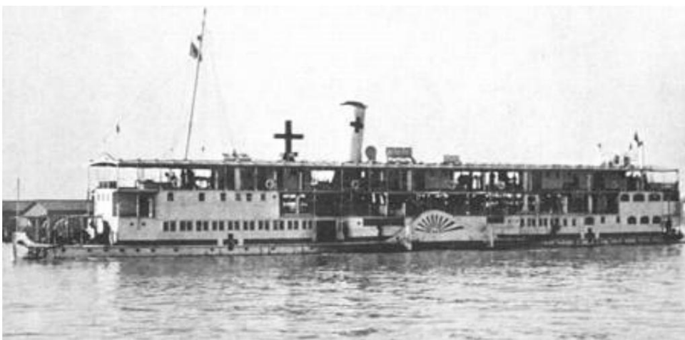
Vapeur à aubes d'hôpital No. 5, photographié sur le Tigre 16 ).

Les problèmes pour le service sanitaire comprenaient que le nombre d'unités sanitaires n'était pas à égalité avec le nombre d'unités combattantes. Il y avait un grand manque de médecins et d'autre personnel qualifié. L'approvisionnement en médicaments et pansements laissait également à désirer, et malgré les gros efforts des unités sanitaires, les malades et les blessés souffraient davantage. (source 11)