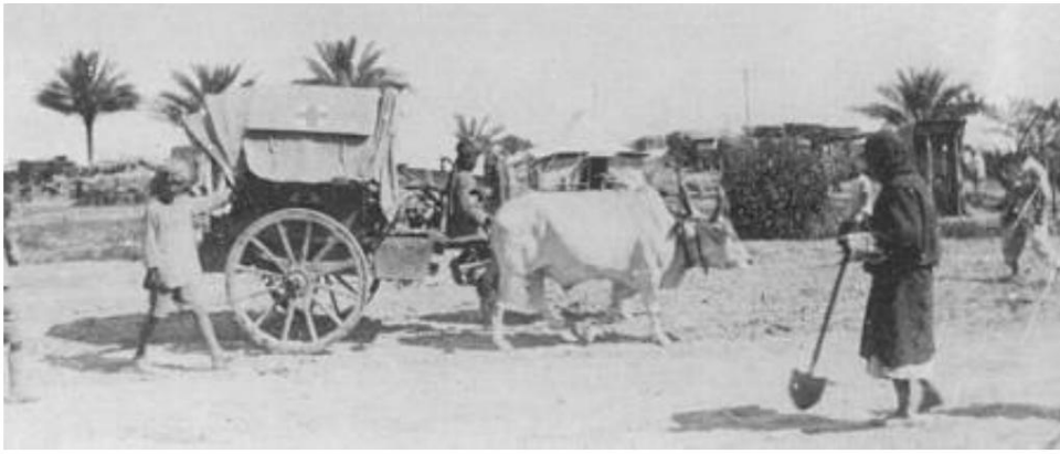
Char à bœufs (Tonga), Mésopotamie. De Source 8.

Les ambulances de campagne indiennes envoyées en France en 1914 étaient équipées de charrettes à mulets, tandis que les chars à bœufs et les chameaux étaient utilisés dans les climats plus chauds. De véritables ambulances de campagne à dos de chameau ont également été installées ici.