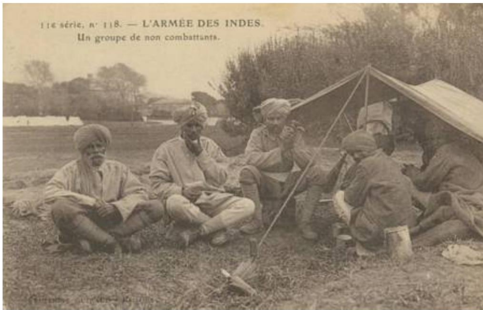
Auxiliaires civils indiens, Marseille, 1914.

À partir d'une carte postale contemporaine, envoyée le 13 février 1915.