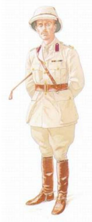
Major, Service médical indien, Moyen-Orient, v. 1916. De Source 8.

Le Corps expéditionnaire indien D, dont les premières unités débarquèrent au sud de Bassorah le 6 novembre 1914, comprenait 6e (Poona) Division 12 ), avec les blocs sanitaires suivants :