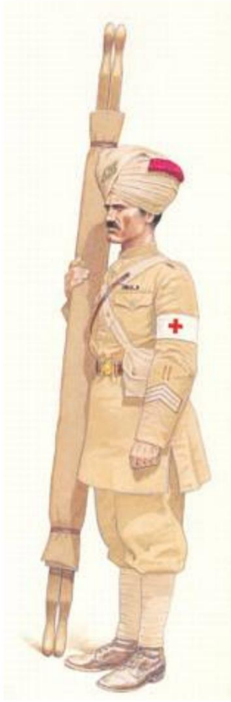
Indian Medical Bearer, Army Bearer Corps, Moyen-Orient, c. 1916. De Source 8.

Les infirmières - et à partir de 1903 également l'Army Bearer Corps - étaient organisées en 10 compagnies, correspondant aux 10 divisions d'infanterie de l'armée indienne, cf. Source 3 2 ).