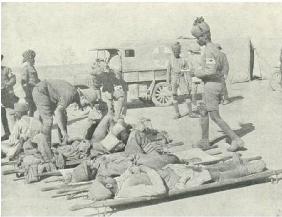
Poste de secours indien en Palestine, env. 1918 15 ).

La première année de guerre révèle de grandes carences dans le service de ravitaillement ainsi que dans l'évacuation et les soins aux malades et aux blessés. Ce n'est que lorsque le lieutenant-général Sir Stanley Maude 14 ), surnommé Systematic Joe, prend le commandement en Mésopotamie en juillet 1916, que la situation s'arrange vraiment.