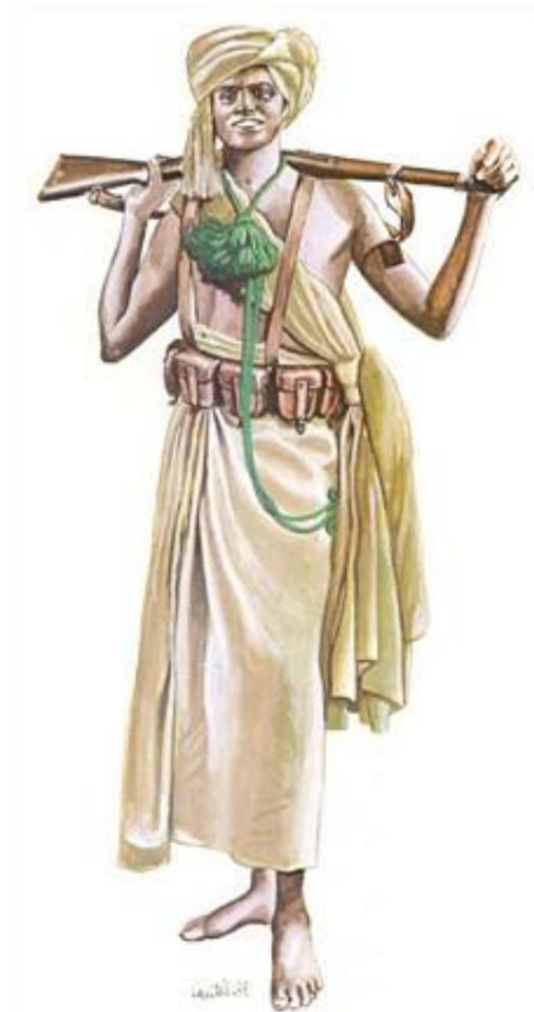
Sergent-chef des troupes frontalières (Dubat) au Somaliland italien, env. 1935. De Source 1.

L'uniforme était une tenue traditionnelle somalienne qui, en plus du turban, comprenait un "coup" porté sur l'épaule droite, ainsi qu'un "kilt", tous deux appelés futa .