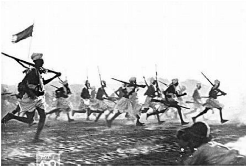
Soldats frontaliers (Dubat) du Somaliland italien, 5 mars 1936 (8). De Campagne d'Éthiopie 1935-36 (Forum Italie 1935-45).

Une médiation a été organisée, mais le résultat, qui est tombé le 3 septembre 1935, n'a rendu responsable aucune des parties, les deux parties ayant supposé qu'elles étaient sur leur propre territoire 7 ). Du côté italien, ils n'étaient pas vraiment intéressés par une solution aux différends frontaliers, et c'est devenu le prétexte pour entrer en guerre contre l'Éthiopie. Le 3 octobre 1935, les troupes italiennes pénètrent en Éthiopie.