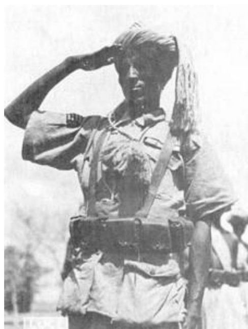
Sous-officier des troupes frontalières

L'uniforme était une tenue traditionnelle somalienne qui, en plus du turban, comprenait un "coup" porté sur l'épaule droite, ainsi qu'un "kilt", tous deux appelés futa .