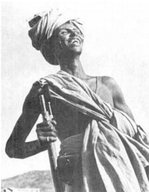
Soldat des troupes frontalières (Dubat) au Somaliland italien, env. 1935. De Source 1.

Au cours de la mission de l'ONU en Somalie 9 ) - Operation Restore Hope - du 9 décembre 1992 au 4 mai 1993, les participants comprenaient unités des parachutistes italiens gardant l'ambassade d'Italie à Mogadiscio.