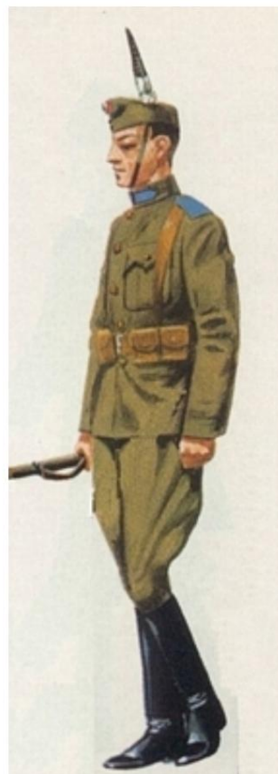
Hussards, 1940. (source 6)