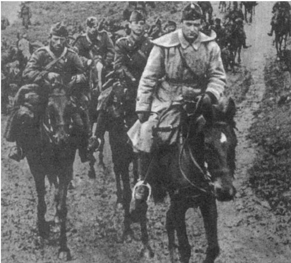
Hussards en marche

L'image donne également une impression de la bride du cheval, ainsi que de la façon dont le manteau du hussard est porté sur les sacoches.