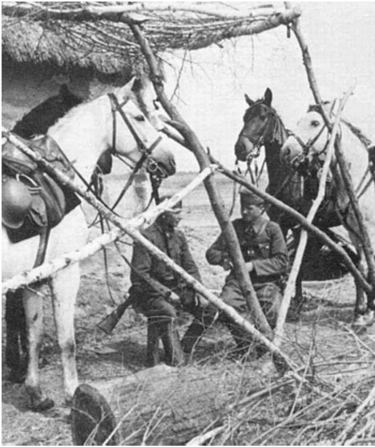
Détenteurs de chevaux

La légende dans la Source 1 est : "Berdichev, automne 1941. Une écurie aérée pour les chevaux Honvéd."