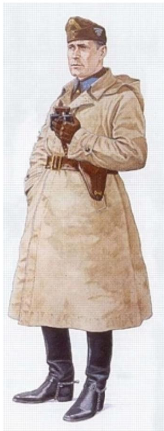
Capitaine, 1941. (source 5)