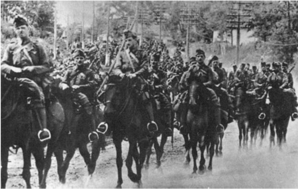
Hussards en marche

La légende de la source 2 ne décrit pas l'image, mais mentionne seulement : "Formé en 1944, le 1er corps de cavalerie avait sous ses ordres les 3e et 4e brigades de cavalerie et la 1re division de cavalerie hongroise."