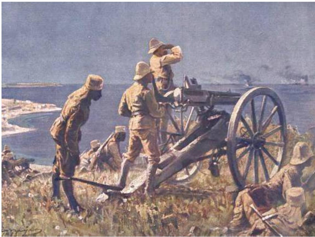
Hilsen de engelske landgangstropper.