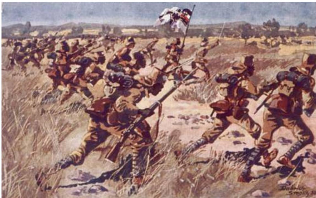
Askaris i angreb.