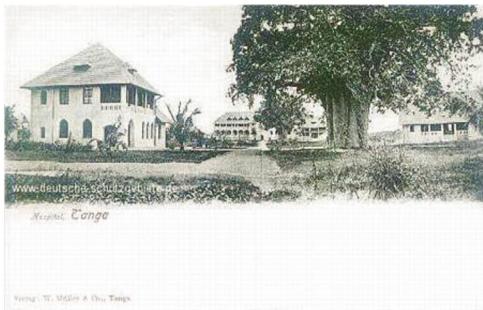
Hospitalet i Tanga.

Tyskerne havde etableret en stærk forsvarsposition, forbundet med felttelefoner og frontet af pigtråd. Der var snigskytter i baobabtræerne og maskingeværer med mellemrum på jorden. Det var en formidabel udfordring for selv de bedste tropper. Men på dette tidspunkt var mange af de indiske soldater i en tilstand af kollaps af hedeslag eller tørst, efter at have drukket indholdet af deres vandflasker, selvom det kun var middag. Da de nærmede sig deres usynlige fjender, råbte Askarierne fornærmelser som "indianere er insekter".