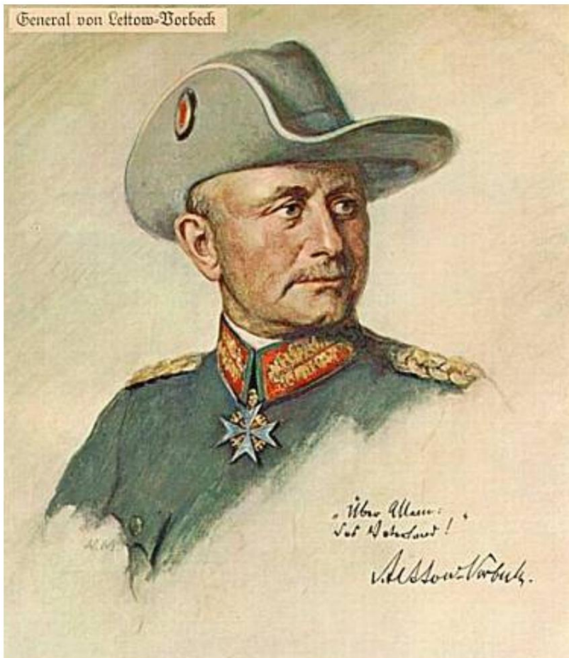
Den øverstkommanderende i det tyske Østafrika Paul Emil von Lettow-Vorbeck.

Fra I de tyske protektoraters fodspor, Østafrika.