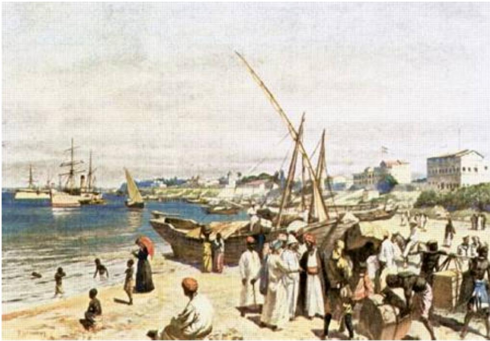
Dar es Salaam.

Tegning af Rudolf Hellgrewe, fra den traditionelle sammenslutning af tidligere beskyttelses- og oversøiske tropper.