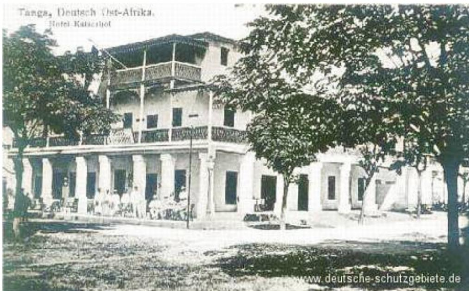
Hotel Kaiserhof i Tanga.

Rasende beordrede Aitken et øjeblikkeligt flådebombardement, som måtte stoppes, da det eneste hit registreret i Tanga faldt på hospitalet, propfyldt med britiske døde og sårede. De andre granater faldt ind i de tilbagegående britiske linjer og forårsagede yderligere tab. De indiske tropper skød så vildt, at de gjorde mere skade på deres egen side end på tyskerne. En soldat fra North Lancs kommenterede: 'Vi har ikke noget imod den tyske ild, men med de fleste af vores officerer og underofficerer nede og en blodig skare af niggere, der skyder ind i ryggen på os, og bier, der stikker i ryggen, er tingene lidt 'harde'.