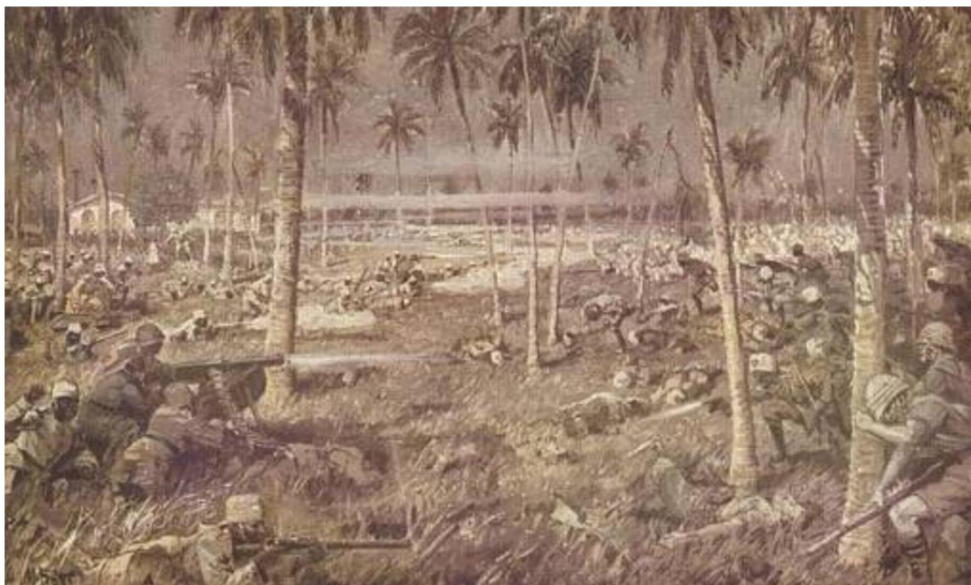
Slaget ved Tanga 3-5 november 1914: