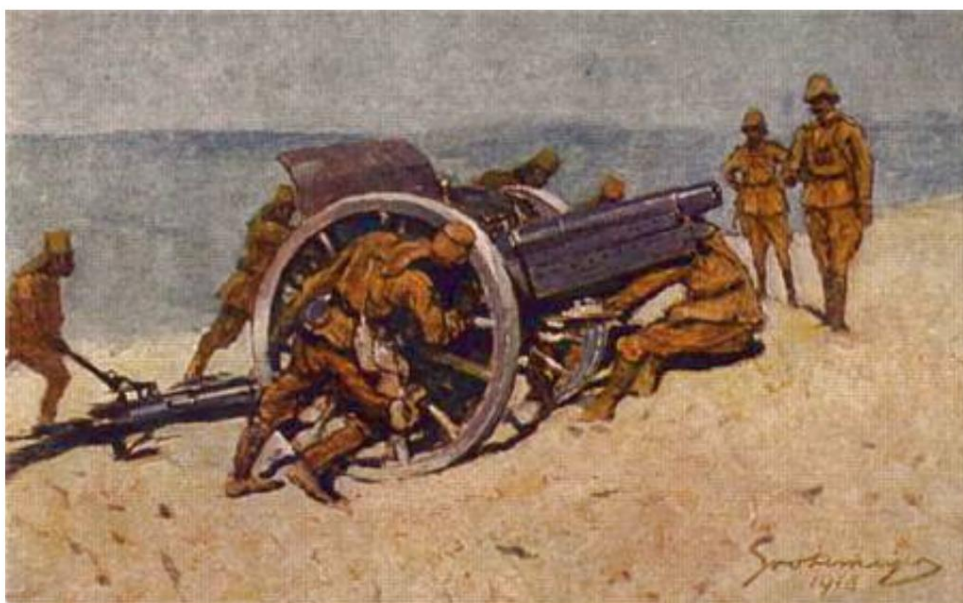
7,7 cm feltkanon Model 1896 fra Tysk Østafrika.

Ved daggry den 5. november 1914 satte kanonerne ild til et engelsk transportskib lige før englænderne flygtede fra området.