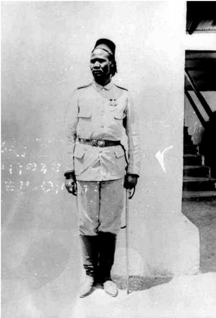
Officier natif (Effendi) de l'Afrique orientale allemande.