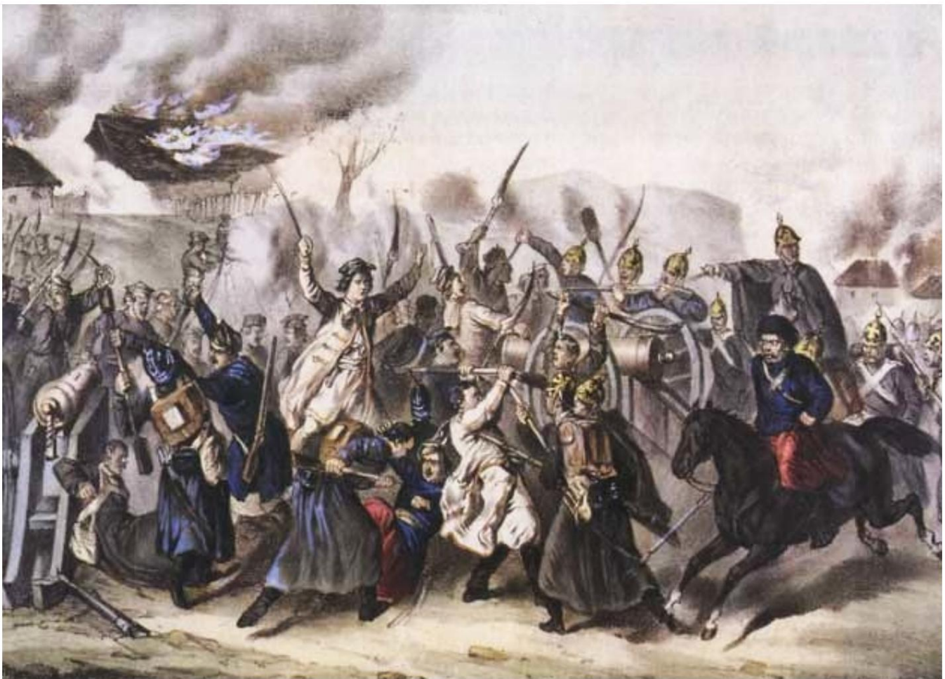
Bataille de Wegrow 1863.

Vous voyez les Russes avec des chapeaux pointus (ce sont les Russes qui les ont inventés et introduits) et les Polonais dans leurs costumes nationaux typiques. Et comme d'habitude, cela a dépassé les pauvres Polonais.