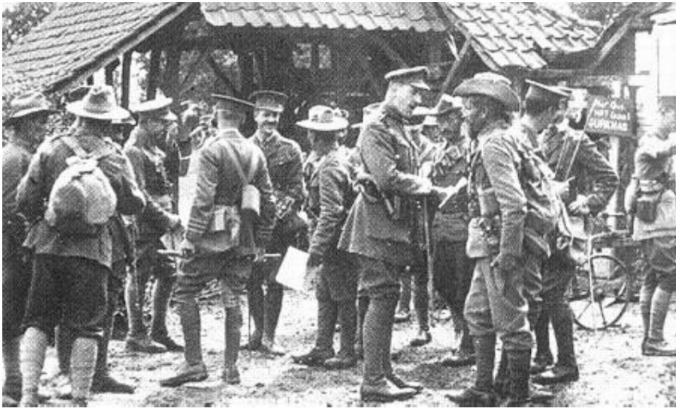
Officier anglais et officiers Gurkha, photographiés devant les quartiers d'état-major du 1/1st Bn. King George's Own Gurkha Rifles (The Malaun Regiment), en France, 1915. 2nd Gurkha Rifles.

D'après la source 9, qui indique qu'il s'agit du signe dans le coin droit de l'image, mais indique "H... Q... 1/1st (KGO) GURKHAS.