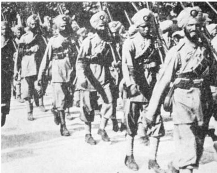
Infanterie indienne en France, 1915.

Officier de cavalerie indien Fra 1914-15 af Roly Grimshaw, DJ Costello (Editeurs) Ltd., Tunbridge Wells, Kent, 1986, ISBN 0-7104-3027-2.