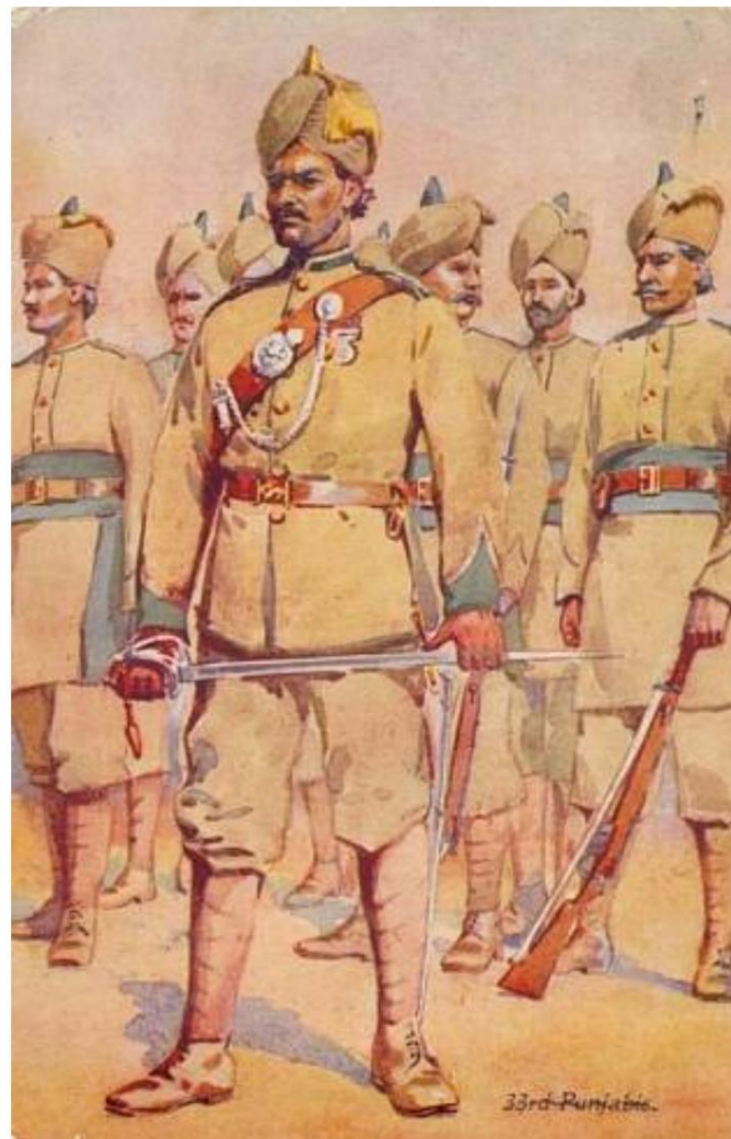
Officier et soldat du 33e Punjabis dessiné par AC Lowett, 1910. Cartes postales de la série "Our Indian Armies", A. & C. Black, Londres, de c. 1920.