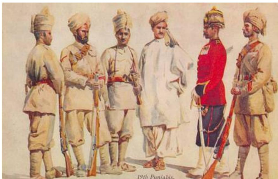
Le 19e Pendjabis.

Dessiné par AC Lowett, 1910. Carte postale de la série "Our Indian Armies", A. & C. Black, Londres, de c. 1920.