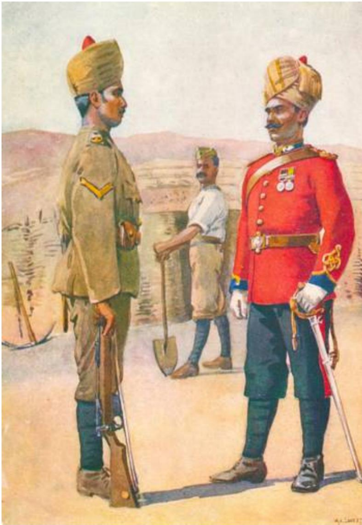
Caporal (lance-naik) et lieutenant (subadar) 3e sapeurs et mineurs.

Avant l'envoi des brahmanes au front, ils avaient accepté d'assouplir leurs règles particulières, mais cela entraînait néanmoins certaines difficultés pratiques, tant au niveau de l'alimentation, des services sanitaires que de la rémunération du personnel.