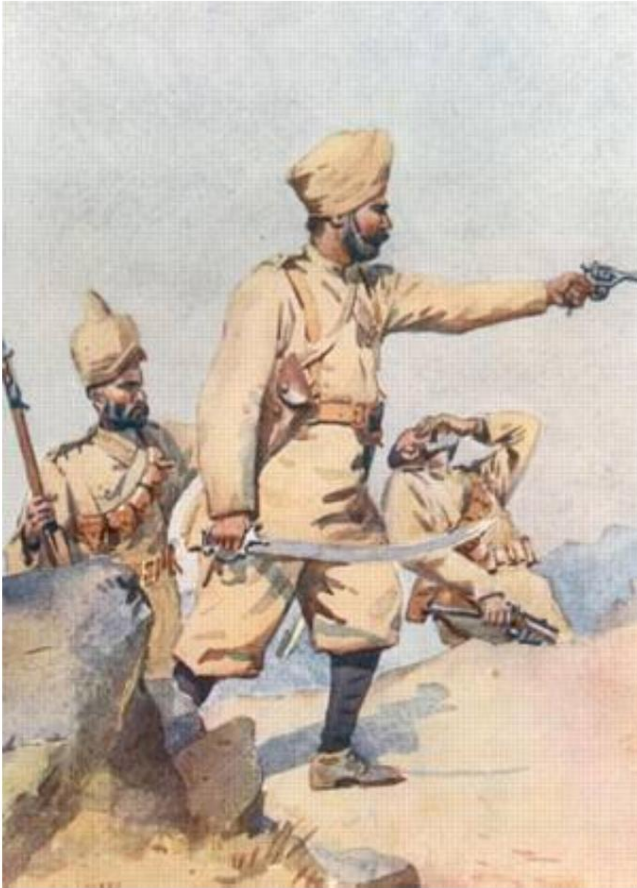
Officiers et soldats, 24e Punjabis. Dessiné par AC Lowett, 1910).

La carte postale montre le bataillon en uniforme de campagne et en uniforme de parade, ainsi qu'un soldat en civil (mufti).