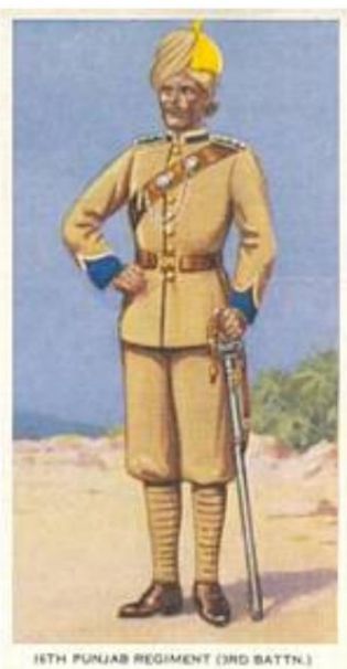
16e régiment du Pendjab (3e bataillon). Carte à cigarettes n° 28 de la série Soldiers of The King publiée par Godfrey Philips Ltd., 1939.