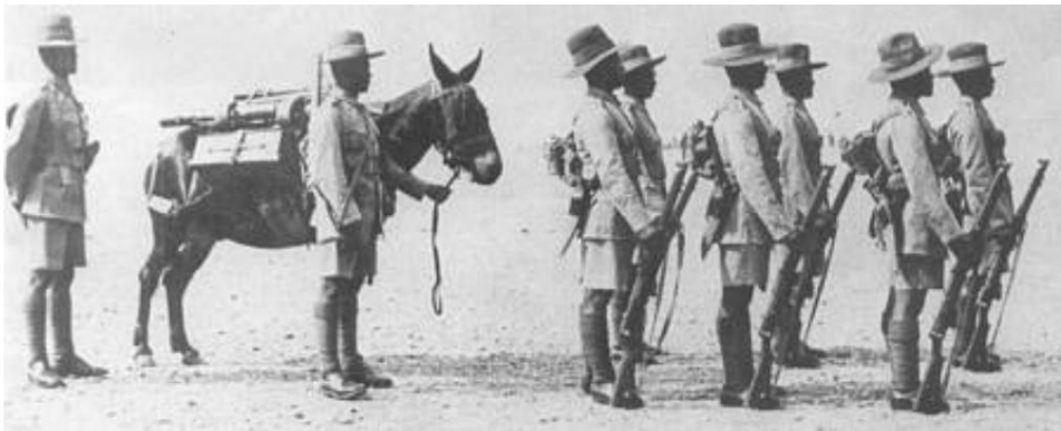
Groupe de mitrailleuses légères du 7th Gurkha Rifles, 1927.

Cependant, les deux bataillons faisaient partie de chaque brigade, chaque division - la brigade Sirhind (division Lahore) et la brigade Dehra Dun (division Meerut) respectivement.