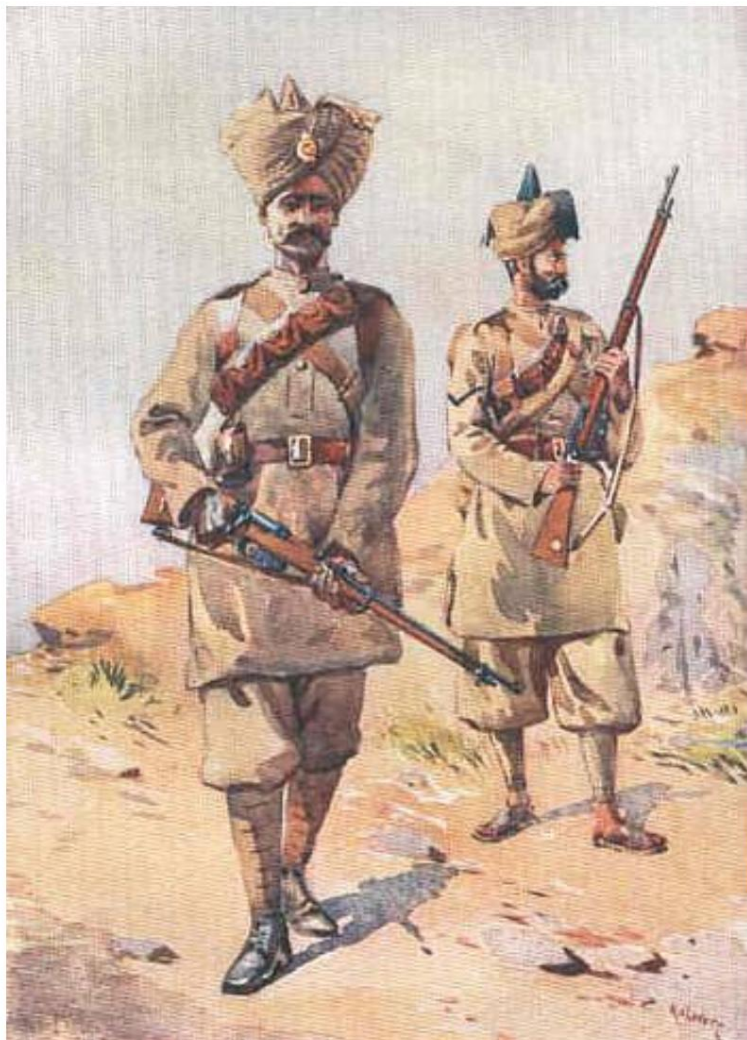
Menig, 30e Punjabis og underkorporal (lance-naik), 20e duc de Cambridge's Own Punjabis. Dessiné par AC Lowett, 1910.