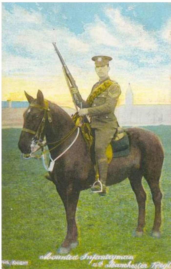
Fantassin à cheval anglais, caporal,

Voir aussi mon article Uniform Plancher - Queen's Own Oxfordshire Hussars, 1897-1915 pour d'autres options de transport.