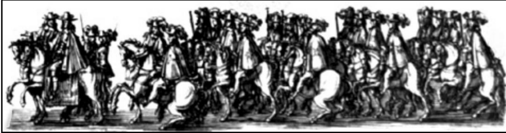
Image simultanée des mousquetaires.