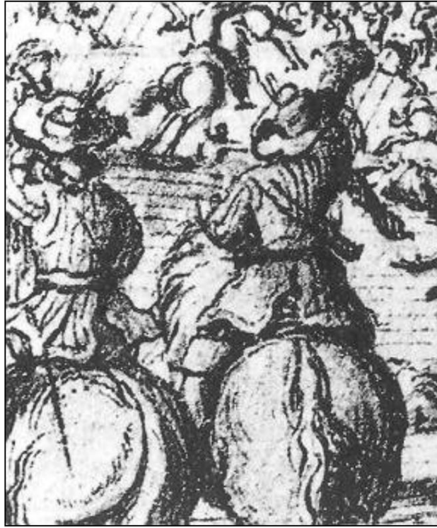
Trompettistes à manches d'abeilles, Bataille de Lund.