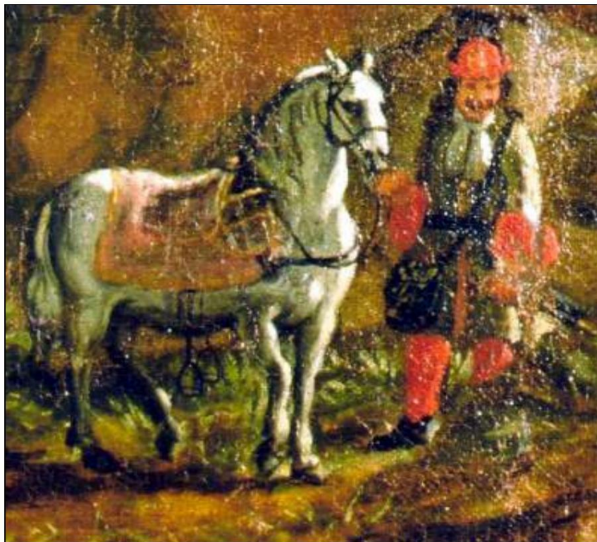
Grenadier norvégien 1699.