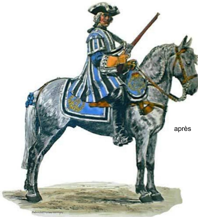
Hartschier in der Casake 1717