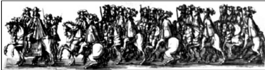
Simultaneous image of the musketeers.