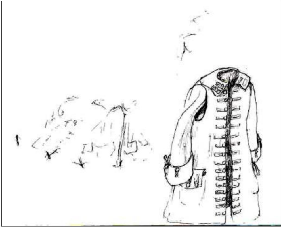
Prussian overcoat, designed by Robert Hall. The Prussian model was designed so that three cloaks could become a tent. You can see here that the soldier was able to stick his arm out through the hole at the shoulder.