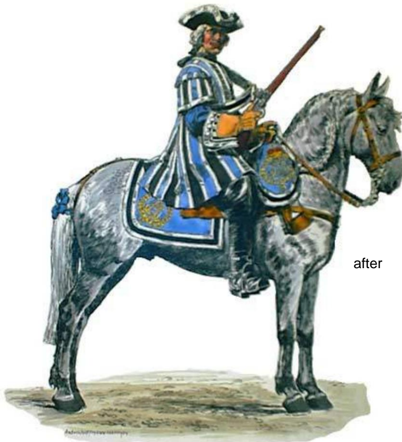
Hartschier in der Casake 1717