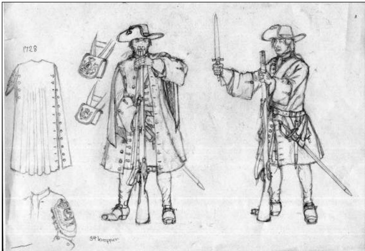
Søren Henriksen's sketch for a Cossack for line infantry ca. 1690.