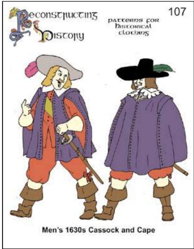
Cossack for about 1630.