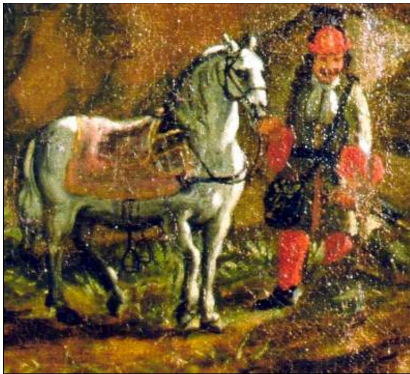
Norwegian grenadier 1699.