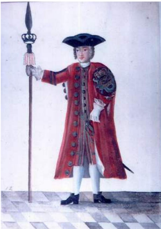
Drabant 1728, Zeichnung von Worgewitz. Das Textilmuseum.