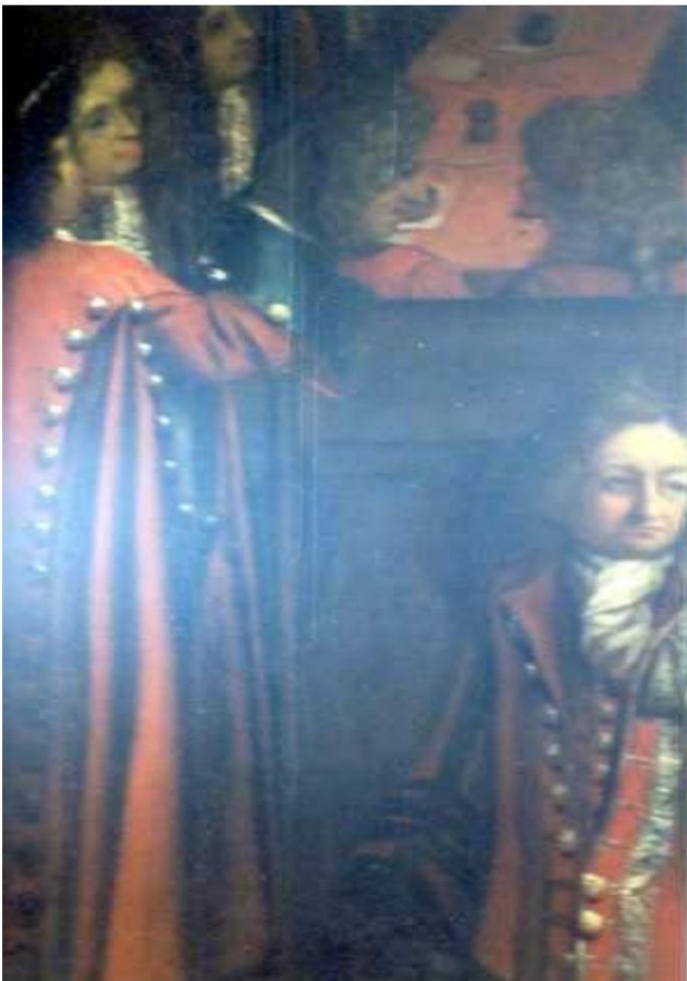
Ausschnitt aus einem Gemälde aus dem Jahr 1699, das die feierliche Eröffnung des Obersten Gerichtshofs unter dem Vorsitz von Christian 5 zeigt. Hier sehen Sie Drabants und vermutlich einige Offiziere der Foot Guards oder der Horse Guards.