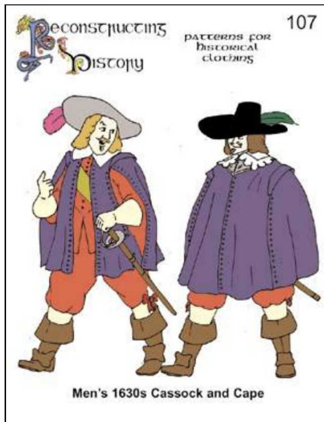
Kosak um 1630.