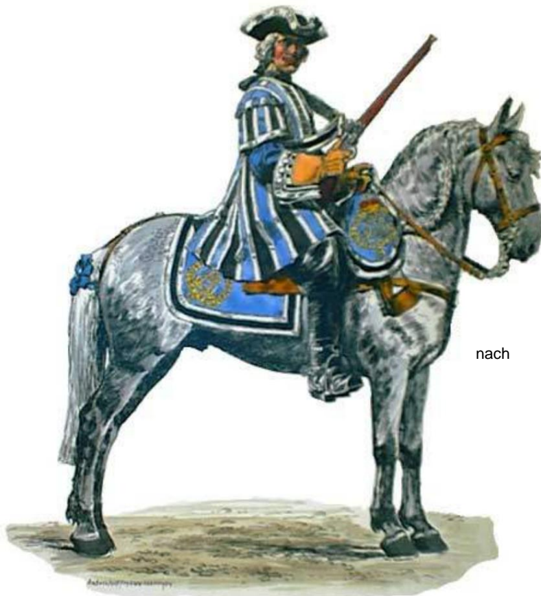
Hartschier in der Casake 1717