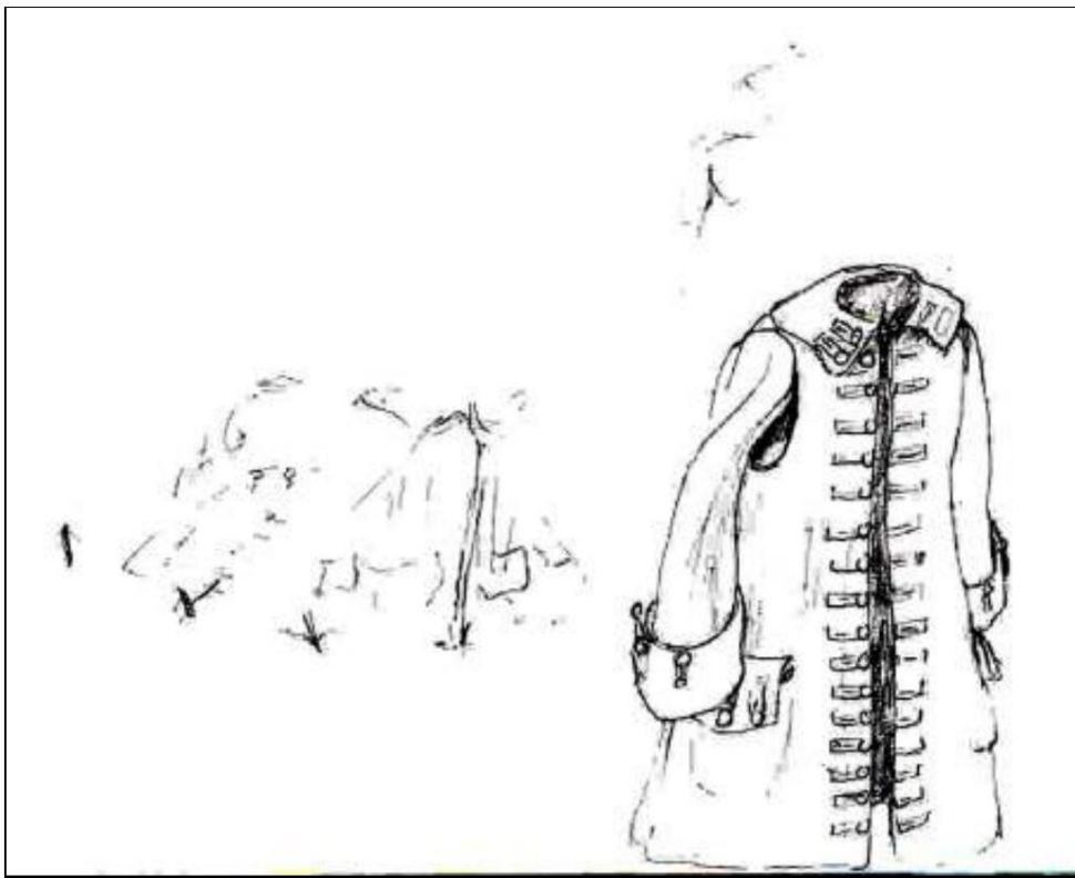
Preußischer Mantel, entworfen von Robert Hall. Das preußische Modell war so konzipiert, dass aus drei Mänteln ein Zelt werden konnte. Hier sieht man, dass der Soldat seinen Arm durch das Loch an der Schulter strecken konnte.