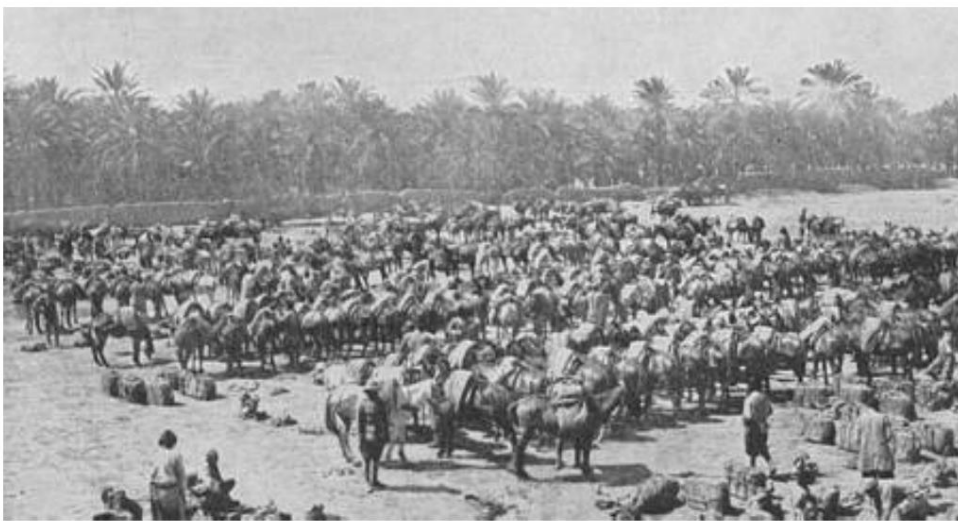
10. Maultierkorps, Basra, 1914.

Die kaiserlichen Diensteinheiten wurden entsprechend den regulären Einheiten aufgenommen, z. in der 6. (Poona) Infanteriedivision 14 ), die u.a. September 1914 bei Basra gekämpft.