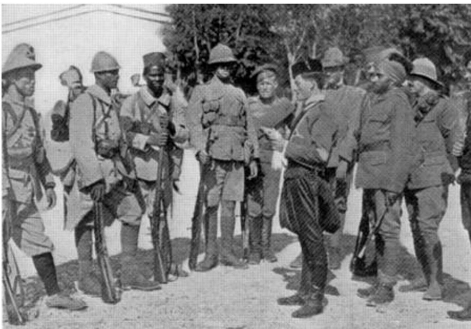
Eine multinationale Truppe, Saloniki, 1917 20).

Auf jeden Fall interessieren hier die sehr undeutlich erscheinenden Soldaten im Hintergrund, denn die einzigen indischen Soldaten an dieser Front bis September 1918 waren meines Wissens das 3rd Mule Corps 19) und das Barapore Transport Corps . Wenn die Bildunterschrift passt, dann müssen es Soldaten dieser Einheiten sein, die im Hintergrund auftauchen.