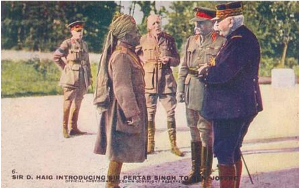
Sir Douglas Haig stellt General Joffre Sir Pertab Singh vor.

Es wird hier erwähnt, dass der Nestor unter den indischen Soldaten in Frankreich – der 70-jährige Maharaja von Jodhpur, dessen englischer Titel Lieutenant General Sir Pertab Singh war – in den Fall verwickelt wurde. Er musste das Dosenfleisch probieren und ja sagen, bevor der letzte Verdacht – zumindest offiziell – ausgeräumt war.