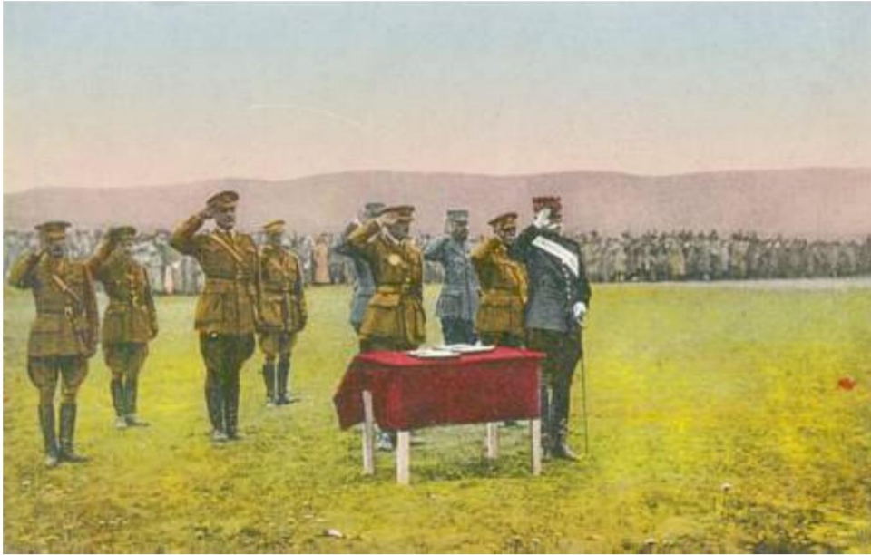
Französischer General Maurice Sarrail 18), mit indischen Soldaten im Hintergrund, Thessaloniki, 1917.

1915 an den Chief of the Indian Army 17) , dass das Indore Transport Corps und das Barapore Transport Corps hervorragende Dienste geleistet haben. Der General beendet seinen Brief mit der Hoffnung, dass der Armeechef das Lob an die richtige Person weiterleitet. (Quelle 15)