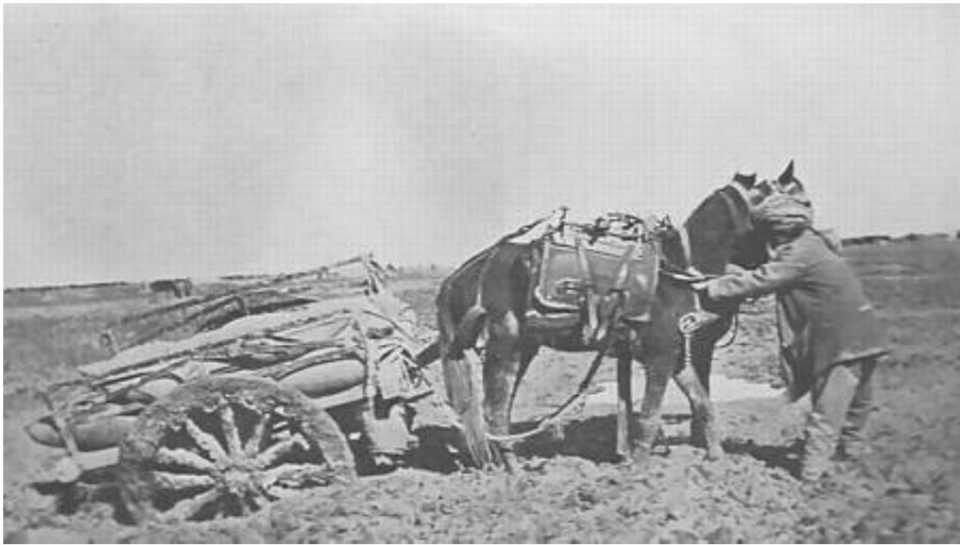
Indischer Maultierkarren steckte im Schlamm fest, Mesopotamien.

Dass das Bild der Ochsenkarren Soldaten aus Jaipur zeigt, ist nicht selbstverständlich, aber man spürt den Staub.