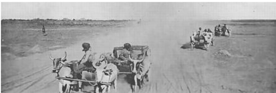
Ochsenkarren, Mesopotamien 16 ).

Die Staubwolke verursachte Panik in den türkischen Linien, da sie glaubten, dass die Staubwolke die vorrückende Kavallerie versteckte.