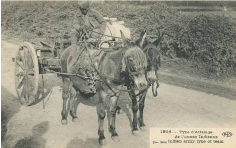
Indischer Maultierkarren, 1914.

Von einer zeitgenössischen französischen Postkarte.