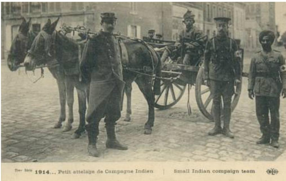
Maultierkarren, Frankreich, 1914.

Von einer zeitgenössischen französischen Postkarte.