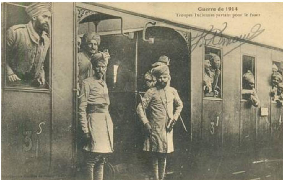
Schienentransport indischer Soldaten, 1914.

Von einer zeitgenössischen französischen Postkarte, gestempelt 13. Dezember 1914 und als Feldpost, d.h. ohne Briefmarke, verschickt.