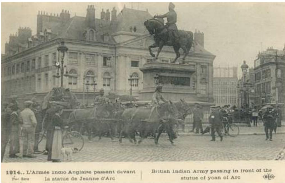
Indische Holzkutsche 6 passiert die Statue von Jeanne d'Arc auf der Place du Martroi in Orléans 7 . ___

Von einer zeitgenössischen französischen Postkarte.