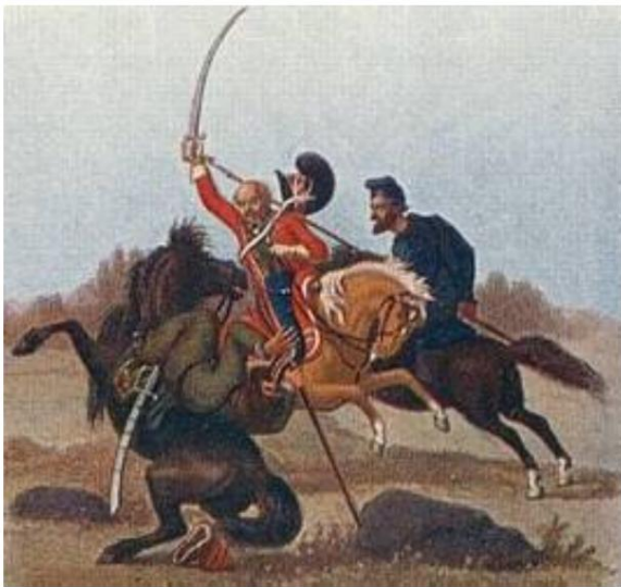
Cosaques russes au combat avec des dragons légers danois

On trouve si peu de preuves d'uniformité non seulement dans l'ensemble de la collection, mais aussi chez l'individu, qu'on voit souvent un cosaque avec une botte sur une jambe et une chaussure sur l'autre jambe, ou avec un bas sur une jambe et le autre nue ou enveloppée de laser ou boutonnée dans une botte conquise.