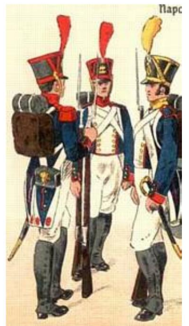
Infanterie française, 1813-15

[page 210] "L'armée suédoise avait une apparence très hideuse. L'infanterie, qui portait des chapeaux ronds avec un anneau de laiton autour du bord près du bord et des plumes jaunes, et des manteaux gris avec des revers courts et tombants, m'a semblé avoir tout à fait l'air et les convenances de la milice citoyenne, et les officiers avec leurs longs pardessus bleus mal cousus à gros boutons jaunes comme les artisans de nos petites villes en habit du dimanche, les grenadiers avec leurs bicornes ronds à bord clouté de crin de cheval. comme sur nos casques de dragon et nos grenades à l'avant, et les chasseurs n'avaient pas l'air beaucoup mieux. Les gens eux-mêmes sont également loin d'être beaux.