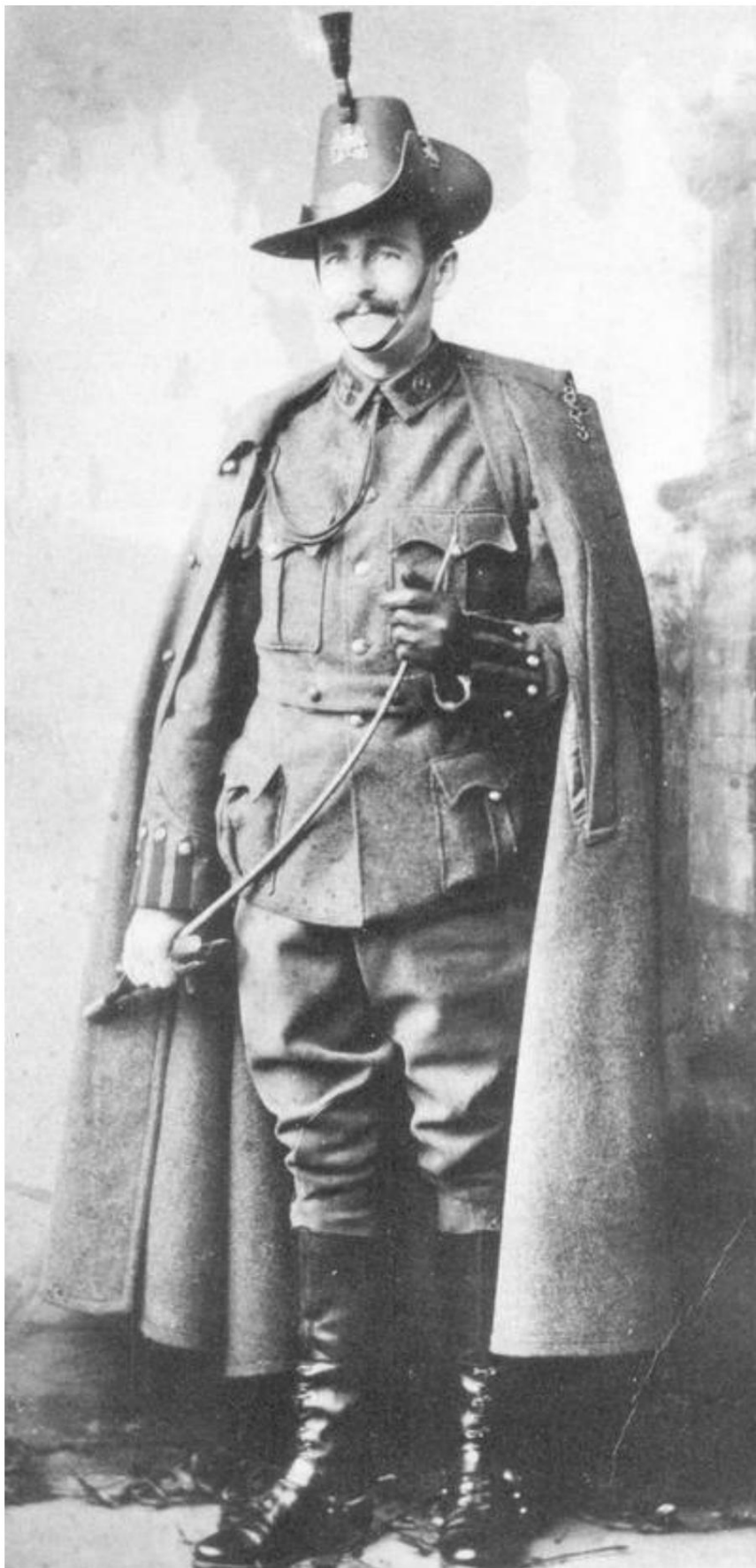
4e comté de Londres Imperial Yeomanry (King's Colonials), menig i paradeuniform (ordre de révision), med kappe, ca. 1902. De Source 2.

Dans la première version de l'uniforme du régiment, le buisson de plumes n'était pas aussi élégant que les dernières plumes de coq noires. Les plumes du buisson de plumes de l'équipage étaient cependant également dans la dernière version, un peu plus courtes que celles des officiers.