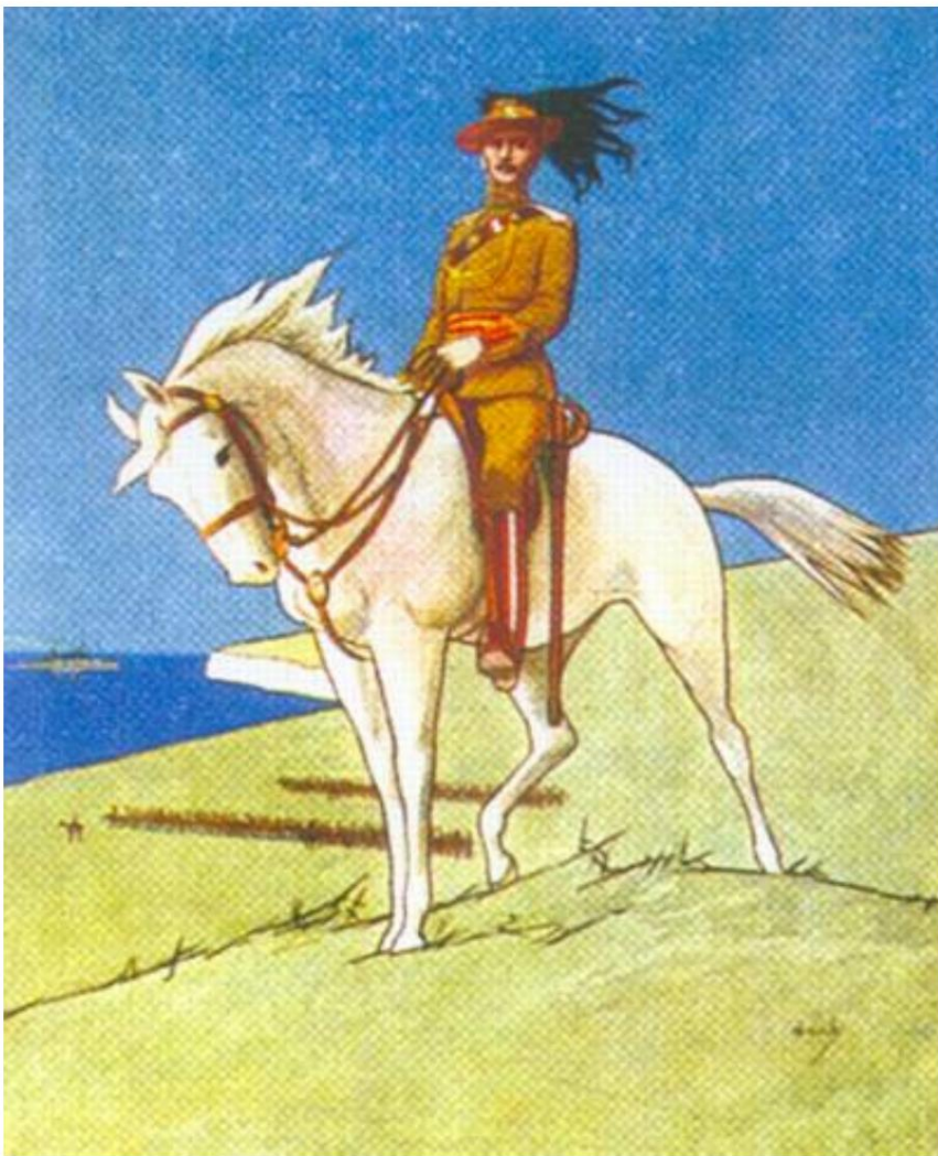
Cheval du roi Édouard, ca. 1913.

Coupe d'une carte postale contemporaine, reproduite dans la Source 4.