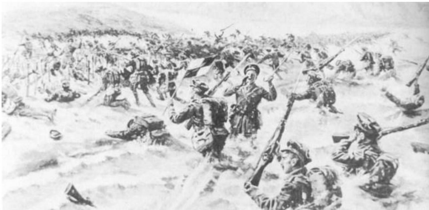
Lancashire Fusiliers débarquant sur W Beach, Gallipoli, 25 avril 1915. De Source 3.

Pratiquement tout tourna mal lors de ce débarquement aux petites heures du matin du 25 avril 1915 et le bataillon perdit plus de 500 hommes tués et blessés.