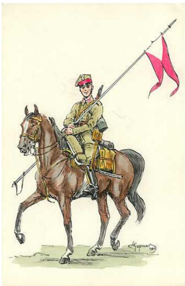
7e régiment de lanciers, 1939.