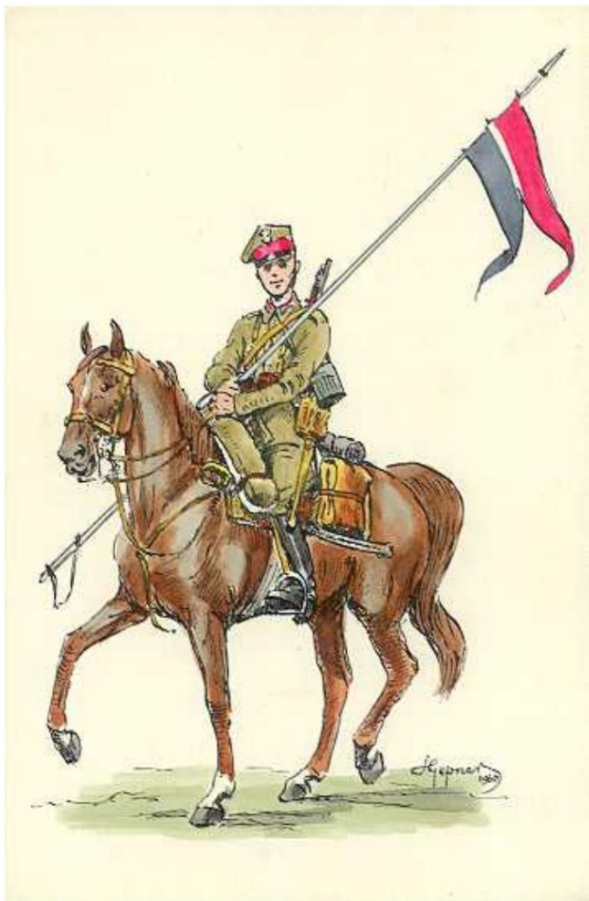
12e régiment de lanciers, 1939.

Les cartes mesurent environ 18,5 x 12,5 cm et sont en carton rigide. De l'arrière, il apparaît que le maître des dessins est Rys. S. Gepner et qu'ils sont publiés dans une série bien nommée Kawaleria Polska, 1939 (Polish Cavalry, 1939). Un ancien propriétaire a inscrit les noms des régiments au crayon. La couverture montre qu'ils ont été dessinés en 1960.