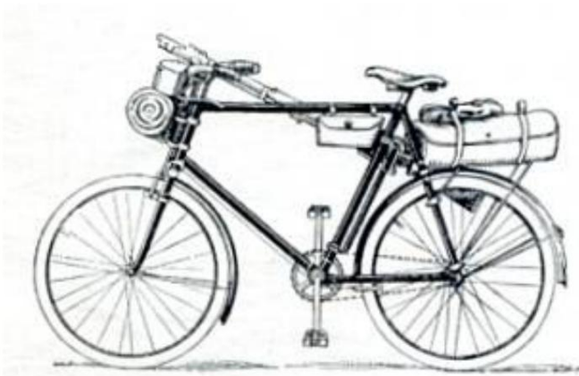
L'emballage réglementaire d'un vélo, env. 1915 20 ).

Dans le passé, il était apparemment plus courant que le dispositif avant soit situé sous le guidon.