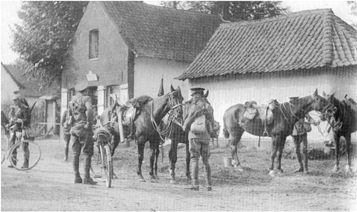
2nd Cavalry Divisions kommandostation, septembre 1914 24 ).

Cette photographie passionnante montre, entre autres, une munition à bicyclette anglaise pouvant appartenir à la section des transmissions d'un régiment de cavalerie (15 bicyclettes). Une autre possibilité est qu'il appartienne à l'escadron des transmissions de la division ou à l'un des pelotons des transmissions de la brigade. Il est en uniforme de cavalier, avec une cartouchière sur la poitrine. Sur la gauche de la photo, vous pouvez voir un ordre de bicyclette français - dragon ou cuirassiers. Au centre de l'image, derrière le cheval de gauche, se trouve le quart de la division.