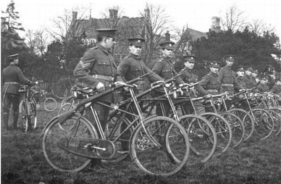
7e bataillon (de cyclistes), The Welsh Regiment, Cardiff, 191119 .

Avant la Première Guerre mondiale, il semble que les cyclistes volontaires fournissaient leur propre vélo.