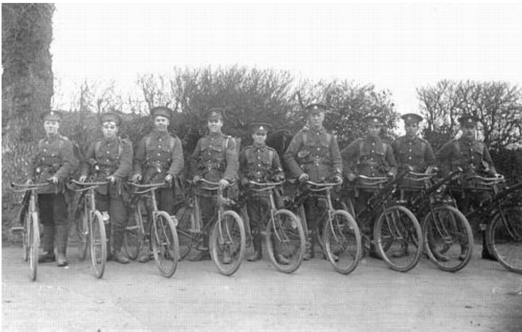
Un groupe de cyclistes, env. 1916. À partir d'une carte postale contemporaine.

On voit ici quelques vélos plus uniformes qui sont probablement des problèmes de l'armée.