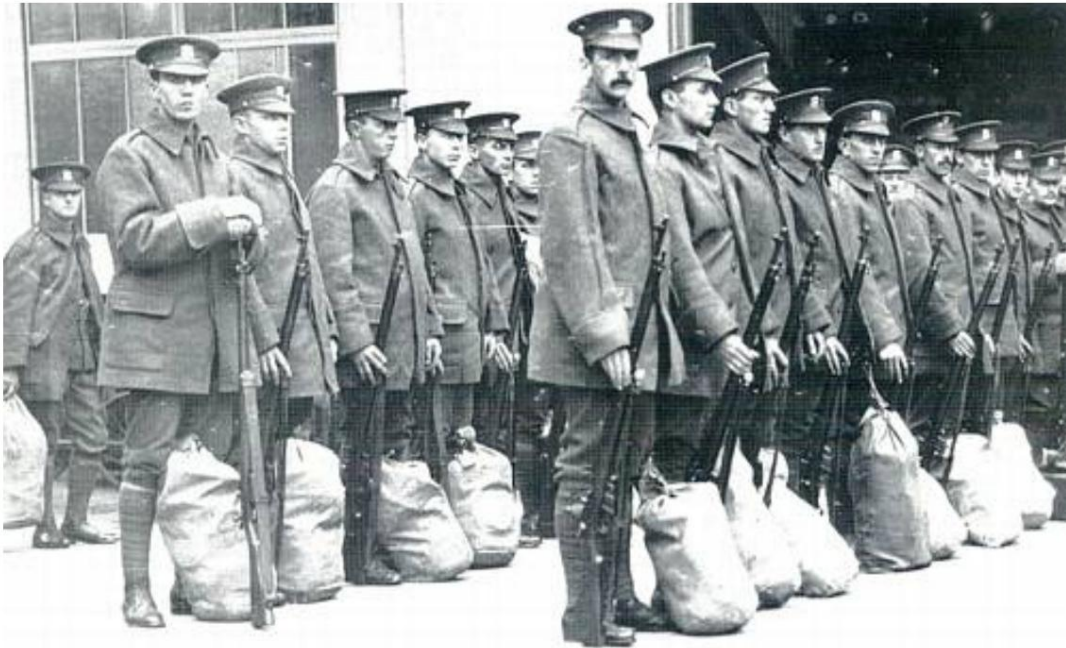
2/7th (Cyclist) Battalion, The Welsh Regiment, Paddington Station, Londres, 1915.

Une autre source 23 précise que la photo date de novembre 1914 et qu'il s'agit de Victoria Station, à Londres.