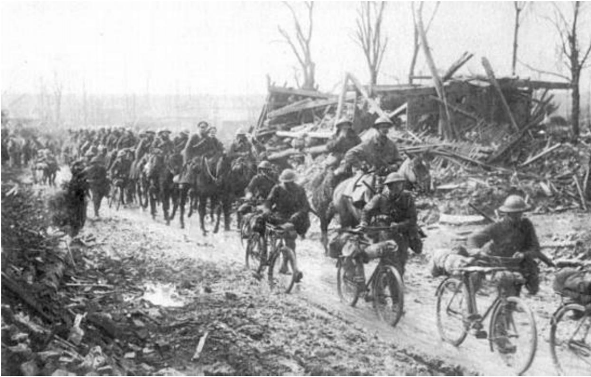
C Squadron, Duke of Lancaster's Own Yeomanry, 3rd Corps Cavalry Regiment, avec des cyclistes (peut-être du 3rd Corps Cyclist Battalion), Somme, 20 mars 1917 14 ).