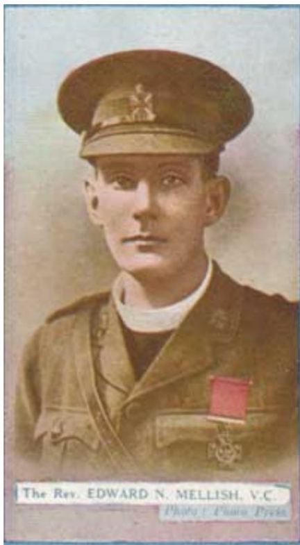
L'aumônier Edward Noel Mellish, qui a reçu la Croix de Victoria en 1916. De Gallaher Cigarette Card n° 114.

Les aumôniers de campagne qui partageaient des conditions avec les soldats gagnaient naturellement un grand respect, tandis que ceux qui apparaissaient rarement au front avaient plus de mal à être pris au sérieux. L'un des points qui distinguaient particulièrement les aumôniers de campagne catholiques des anglicans était les instructions données par les autorités ecclésiastiques respectives. Les aumôniers de campagne catholiques devaient faire leur travail partout, tandis que les anglicans, au sens le plus littéral, devaient être plus sobres - ils feraient mieux de ne pas trop s'avancer vers les lignes de bataille. Cependant, de nombreux aumôniers de campagne anglicans prenaient ces instructions au sérieux et étaient au moins aussi directs avec les soldats que leurs collègues catholiques.