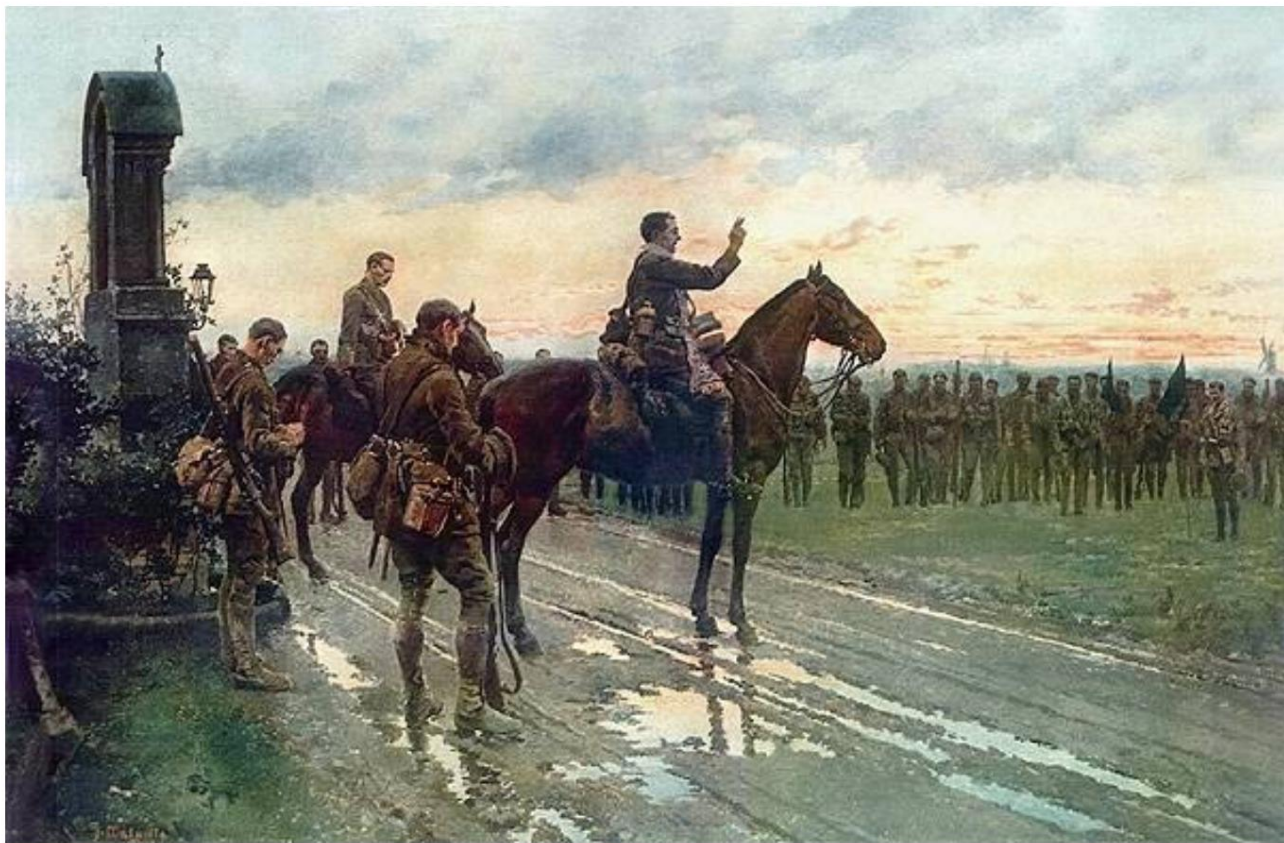
Service sur le terrain par le 2e Bataillon, Royal Munster Fusiliers, 8 mai 1915. La Dernière Absolution des Munsters.

Le tableau a été peint par l'Italien Fortunino Matania (1881-1963), qui était associé au ministère britannique de la Propagande. Ses nombreuses photos et dessins ont été publiés dans The Sphere , Illustrated London News et L'Illustration , entre autres .