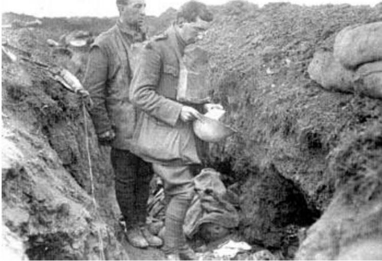
Enterrement d'urgence, 1916. Source 1.