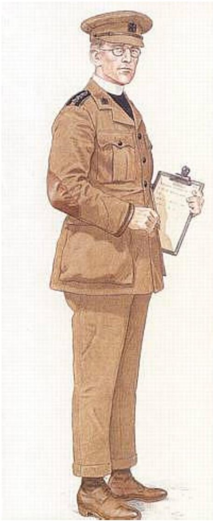
Aumônier de campagne anglais (aumônier des forces de classe IV), env. 1916.

Dessiné par Mike Chappel et reproduit de The British Army in World War I (1) - The Western Front 1914-16.