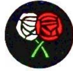
Unités de marque de division de Lancaster. Produit sur la base de la source 4.

La marque divisionnaire géométrique, dont le symbolisme est inconnu, est remplacée en juillet 1917 par une marque faisant allusion à l'appartenance géographique de la division - à savoir la rose blanche et rouge, symbolisant les comtés de York et de Lancaster.