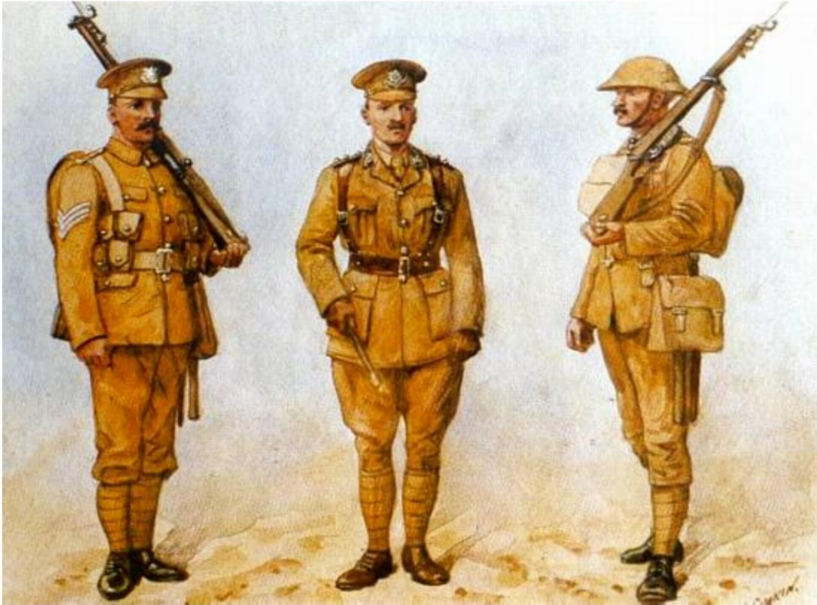
Régiment du Yorkshire de l'Est, 1914-1920.