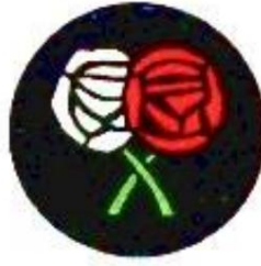
Unités de marque de division de York. De Source 4.