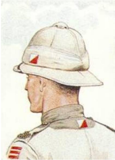
Soldat du 18e Bn. The Prince of Wales's Own (West Yorkshire Regiment) (2e Bradford Pals), 93e Brigade, 31e Division, Égypte, 1915.

Sur les casques de troupe, les marques étaient en tissu, tandis que sur les casques en acier, les marques étaient peintes; si le casque était équipé d'une housse (souvent fabriquée à partir de sacs de sable ou, dans le cas de certains officiers, d'une version spécialement adaptée), un badge en tissu était utilisé, porté soit sur le devant, soit sur le côté. Les images disponibles ne suggèrent pas ce qui était habituel dans la division ou ses divisions.