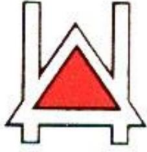
Insigne de division pour juillet 1917. De Source 4.