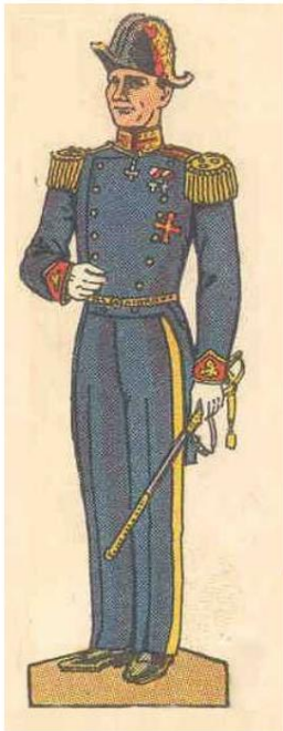
Prince héritier Frederik