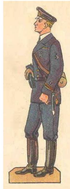
Machiniste du 3ème degré