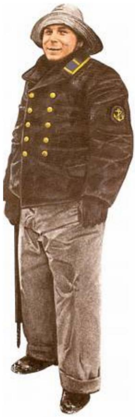
Korvettenkapitän (capitaine de guerre) 1940 (à gauche)

Uniforme de service bleu avec gants gris; le poignard M/1938 pouvait également être porté avec cette tenue. L'insigne de service au-dessus de l'insigne de grade de la manche - une étoile indique que la carrière de cet officier est officier de marine (tacticien / commandant de navire, etc.) Les décorations sont la classe Iron Cross I et II et la décoration blessée en noir (blessé 1-2 fois). Sur l'ombre du capuchon une seule rangée de feuilles de chêne (tang de la vessie); le signe d'un diplôme supérieur. Le kapitänleutnant de rang inférieur le plus proche ( Ka'leun = argot ) ( Kaptajnlejtnant ) est le grade d'officier subalterne le plus ancien, ce grade ne portait pas de feuilles de chêne sur la casquette.