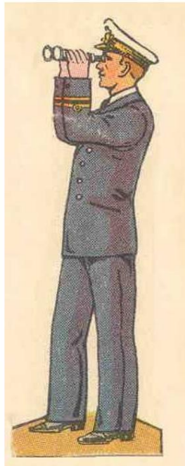
Lieutenant de vaisseau du 1er degré