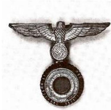
Mannschaftsmütze: Hoheitsabzeichen, Kokarde

Après le radoub, le NORDLAND a été déplacé à Stolpmünde (aujourd'hui Ustka en Pologne) en 1944, où il a servi de navire anti-flak et de navire-école jusqu'à ce qu'il soit retiré en 1945 et se retrouve dans la baie d'Eckernförde à la fin de la guerre.