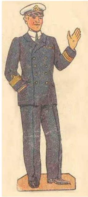
Capitaine de guerre