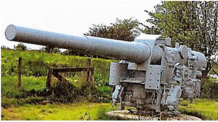
En position ouverte, pas de restrictions latérales.