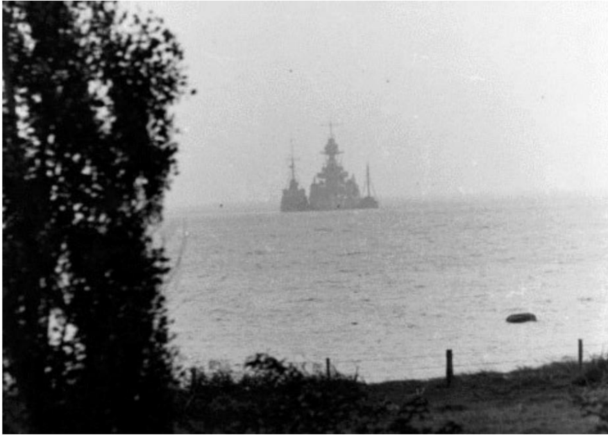
Niels luel sur terrain env. 100m de terre à Issefjorden.

Après la bataille d'Issefjorden, l'histoire du navire a changé.