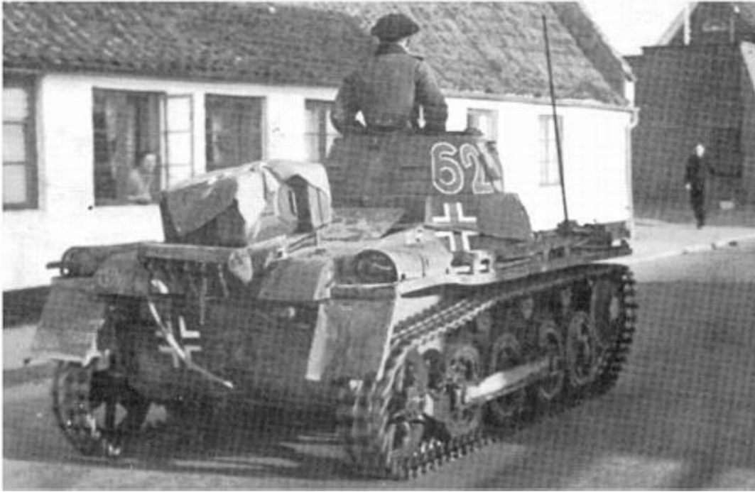
Un char allemand au Danemark, le 9 avril 1940. (Source inconnue.)