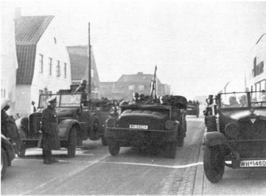
L'avancée allemande à travers Aabenraa, le 9 avril 1940.

La 170th Infantry Division comprenait les unités suivantes: