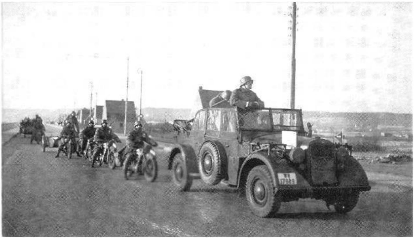
Une colonne allemande, 9 avril 1940.