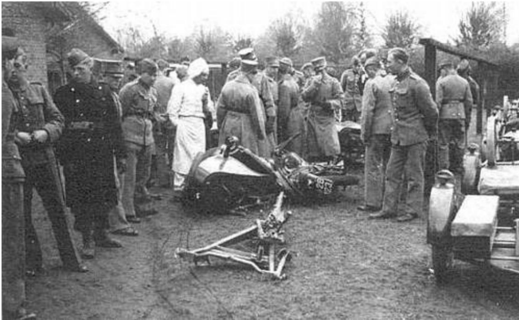
Point de collecte du matériel endommagé. De Source 3.

Peut-être que les mots "L'armée allemande ..." auraient été un titre approprié puisque le contenu concerne principalement les forces opposées à l'armée danoise, mais j'ai finalement décidé de faire de l'article une suite aux parties 1 et 2.