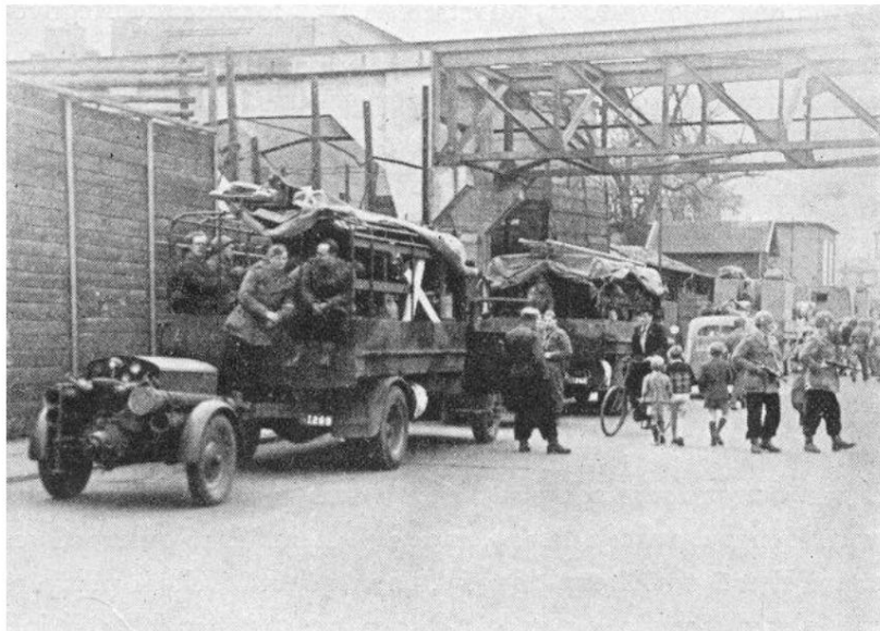
Certains des véhicules des pompiers du Fire Command, Helsingborg, 5 mai 1945. De Source 1.

L'organisation et la fonction du commandement de tir ont été calquées sur les colonnes danoises de la CBU. En termes de tâches, cependant, il y avait la différence que le Fire Command devait résoudre des tâches pendant les combats et les bombardements , tandis que les colonnes CBU résolvaient leurs tâches après une attaque aérienne .