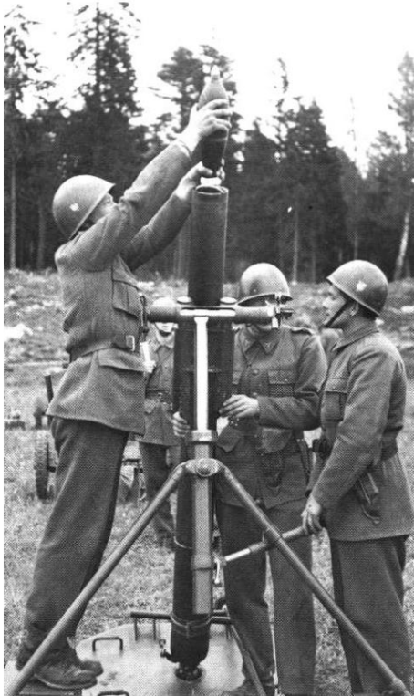
Lance-grenades de 12 cm m/41, avec équipage suédois.

Ce n'était probablement pas exactement cet accueil auquel les mortarmen et les autres brigadiers s'étaient attendus lorsqu'ils débarquèrent au Danemark, mais la situation ayant évolué, ils furent reçus par des Danois joyeux et non par un ennemi belliqueux.