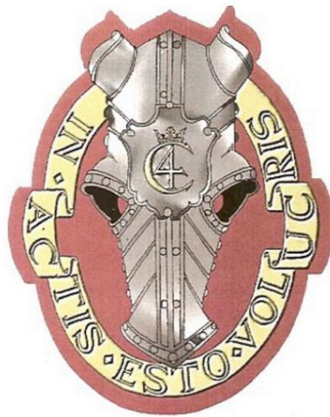
Det nye regimentsmærke

Men i et forsøg på at gøre alle tilfredse, blev det besluttet, at det "nye" regiment skulle have et nyt skilt.