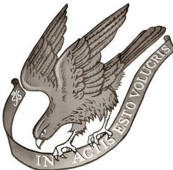
Det gamle regimentsmærke

Med en politisk beslutning om at reducere hæren i 1999 og sammenlægningen af tre gamle regimenter - alle med en meget lang historie - sluttede situationen. Regimentets navn blev ved med at være GARDEHUSARREGIMENTET.