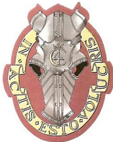
Das neue Regimentsabzeichen

Aber um alle zufrieden zu stellen, wurde entschieden, dass das „neue“ Regiment ein neues Abzeichen bekommen musste.