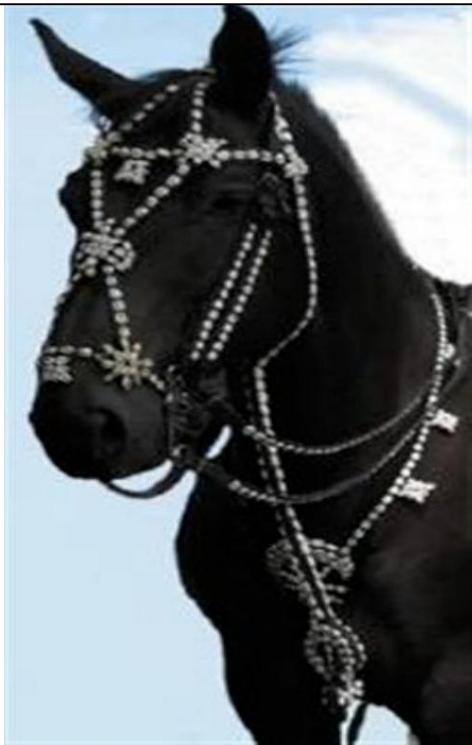
Paradekopfstück des Offiziers (snekketøj); es besteht aus Schneckenhäusern, die an den Lederzügeln befestigt sind.