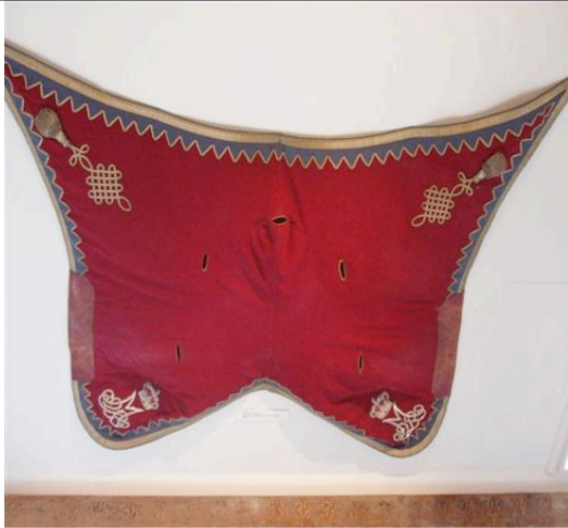
Offiziersschäbracke (Valdrap) mit allen Verzierungen in silberner Spitze.