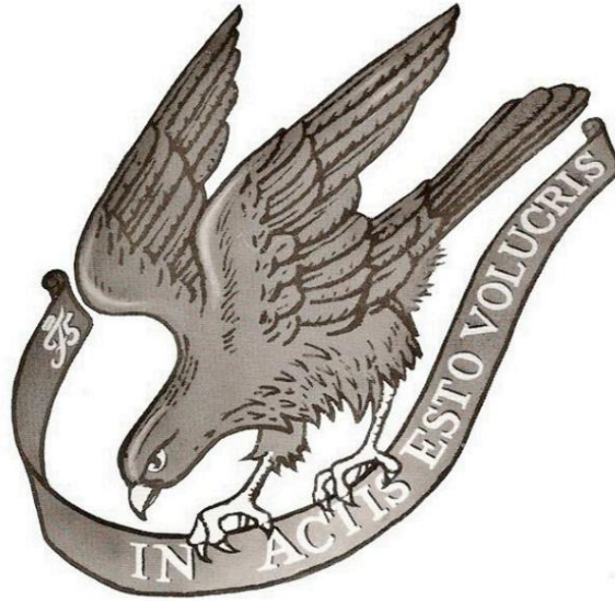
Das alte Regimentsabzeichen

Mit einer politischen Entscheidung zur Reduzierung der Armee im Jahr 1999 und der Zusammenlegung von drei alten Regimentern - alle mit einer sehr langen Geschichte - endete der Zustand. Der Name des Regiments lautete weiterhin GARDEHUSARREGIMENTET.