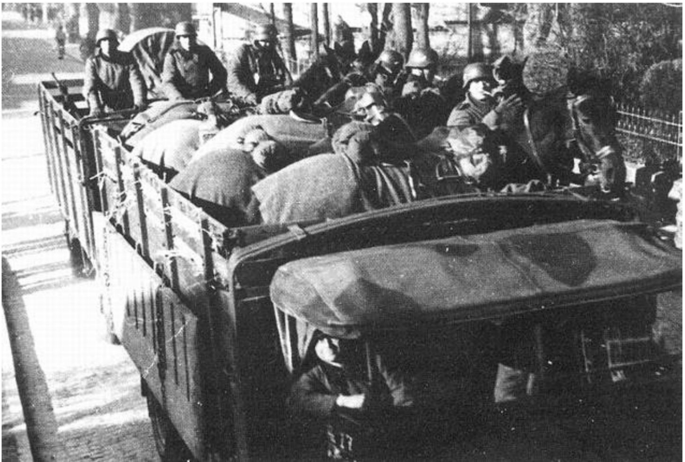
Pferde und ein von Pferden gezogenes Fahrzeug, verladen auf einen Lastwagen, fahren durch Aabenraa. Von Quelle 1.