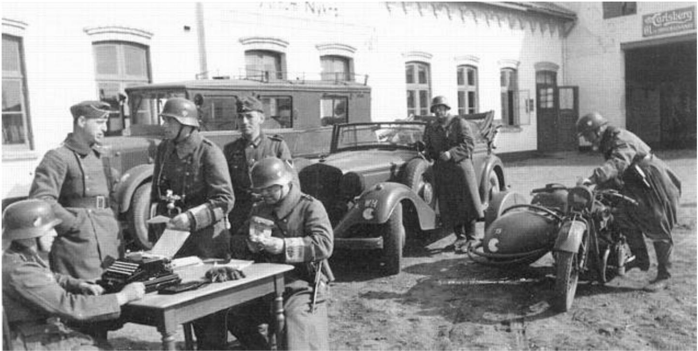
Ein deutscher Kommandoposten bei Arnum Nykro.