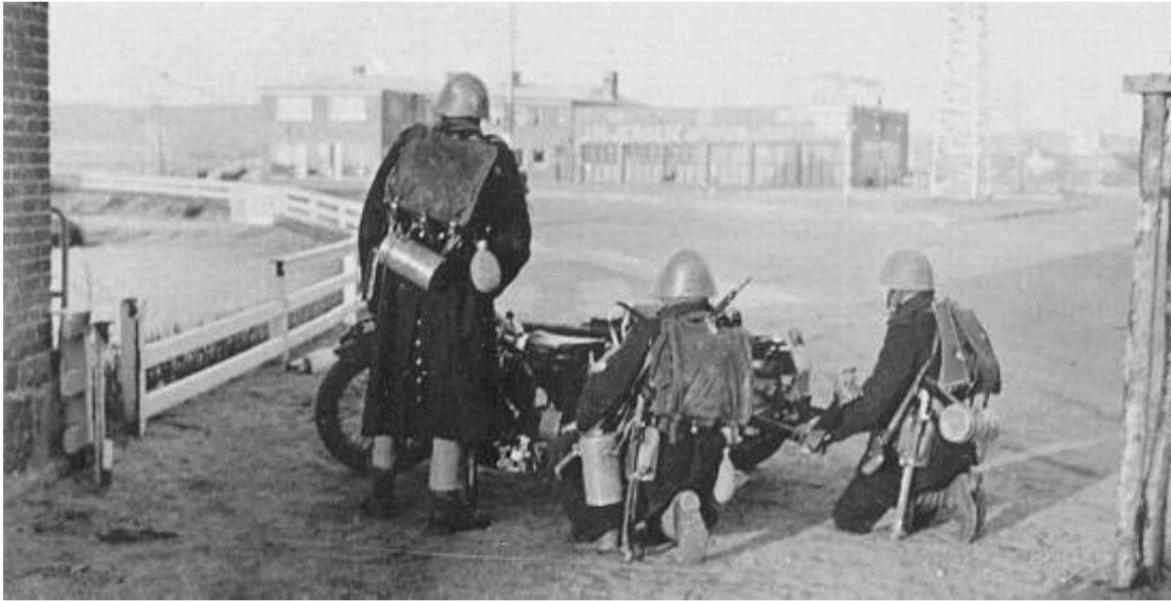
En af autokanonerne i udkanten af Aabenraa, lige før den tyske kolonne ankom. Fra kilde 2.

Panserværnsdelingen fra Lundtoftebjerg Detachment blev beordret til Aabenraa og indtog stillinger i den sydlige udkant. Kort efter kørte en kolonne på omkring 15 fjendtlige køretøjer op ad Highway 10.