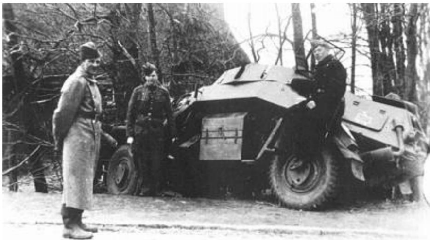
danske soldater og en handicappet tysk panservogn ved Bredevad.