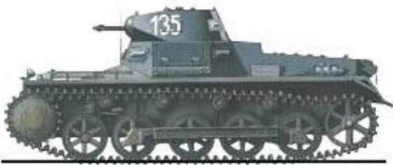
Tysk Pz I.