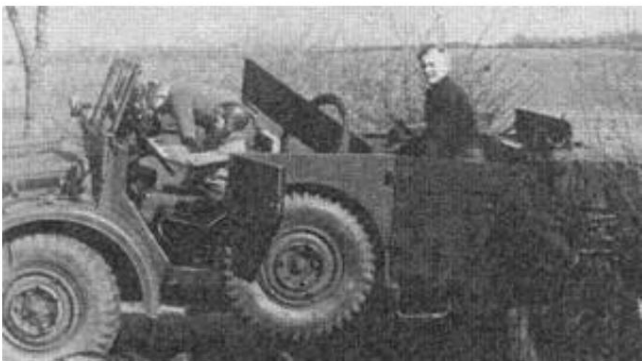
En tysk SdKfz 15 bil beskadiget ved Hokkerup i de tidlige timer den 9. april 1940. Fra kilde 2.

Afdelingen blev derefter marcheret mod syd som krigsfanger, men på grund af våbenhvilen var de tilbage med deres enheder senere samme dag.