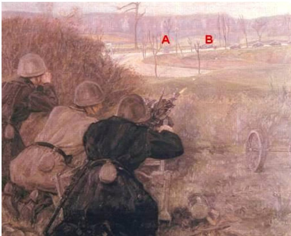
20 mm autokanonnen ved Hokkerup, som malet af Anna Maria Mehrn.