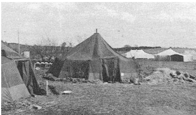
Teltlejren ved Gödelöv, april/maj 1945. Fra Kilde 2.

Feltlazarettets materiel fyldte, når det var pakket, 8 store lastvogne, som blev transporteret ved Motorvognskompagniets foranstaltning.