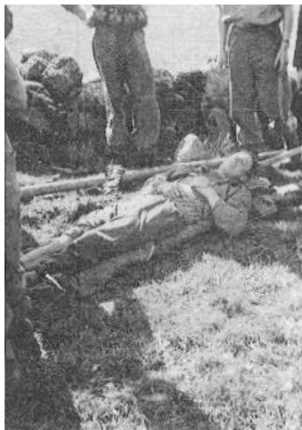
Båreeksercits, Håttunaholm, juli 1944. Fra Kilde 2.