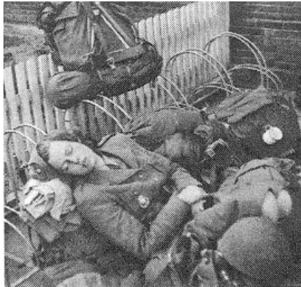
Sanitetslotte, Helsingør, 6. maj 1945.