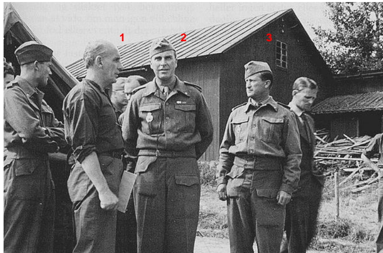
Generalmajor Kristian Knudtzon inspicerer en sanitetsøvelse i Håttunaholm- forlægningen, juli 1944. Fra Kilde 5.

På billedet ses brigadelæge Terp (1), generalmajor Knudtzon (2) samt stabschefen, kaptajn P.A.F. Norup (3).