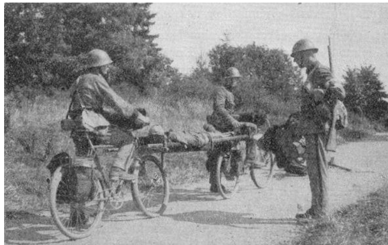
Eksempel på cykelbåremateriellet, her vist med svenske soldater. Fra Kilde 8.