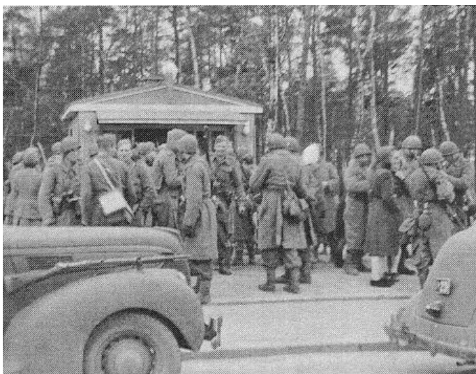
Sanitetskompagniet holder hvil, på vej mod Helsingborg, 5. maj 1945. Fra Kilde 2.

Af kompagniets dagbog, som citeres i Kilde 2, fremgår det, at marchen til Helsingborg den 5. maj 1945 foregik i kompagniets egne 5 personvogne og 8 lastvogne, suppleret med 14 køretøjer, som dels kom fra Motorvognskompagniet dels fra den pulje af svenske militærkøretøjer, som var stillet til rådighed for Brigadens transport til Helsingborg.