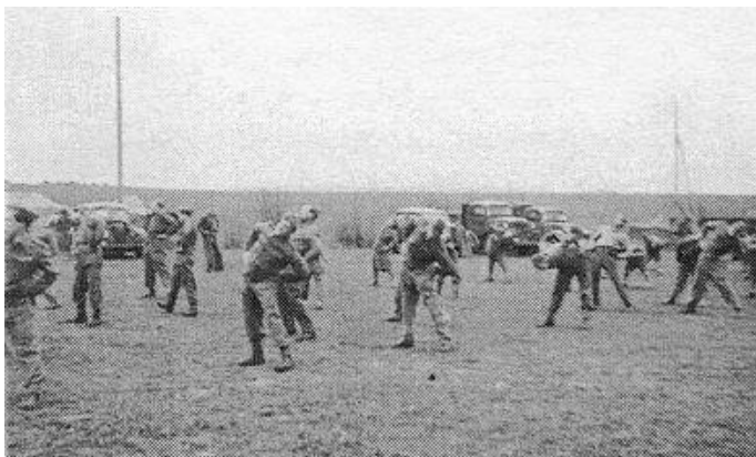
Morgengymnastik, Gödelöv, april/maj 1945. Fra Kilde 2.

I baggrunden anes nogle af kompagniets køretøjer.