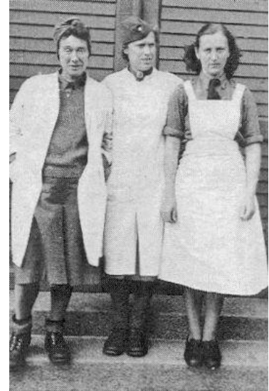
To sygeplejersker og en sanitets- lotte', Tønder, sommeren 1945.