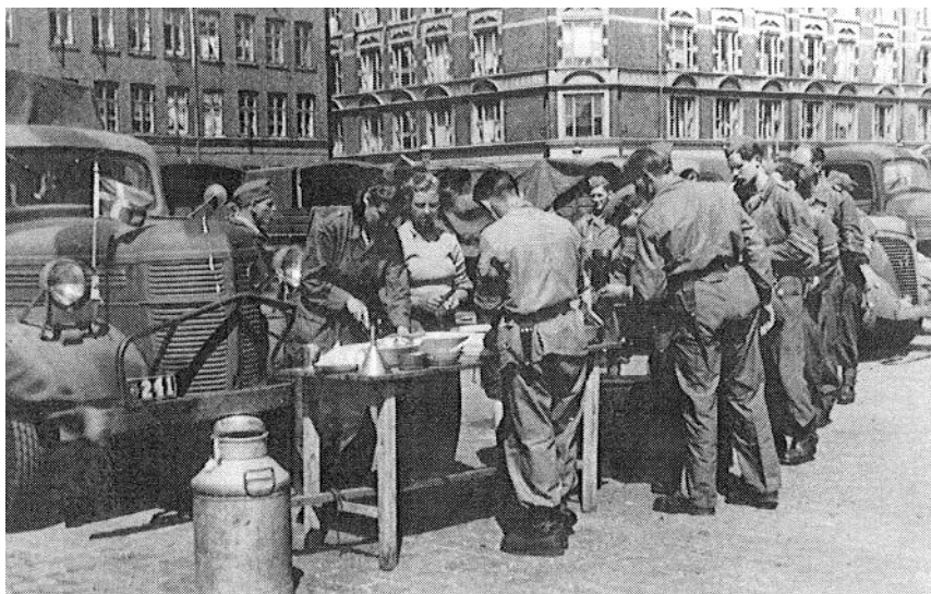
Forplejning på Halmtorvet i København, maj 1945. Fra Kilde 6.

Der kan være tale om Køkkenhold 17, der indgik i 5. (tunge) Bataljons, 4. Kompagni (Maskingeværkompagni).