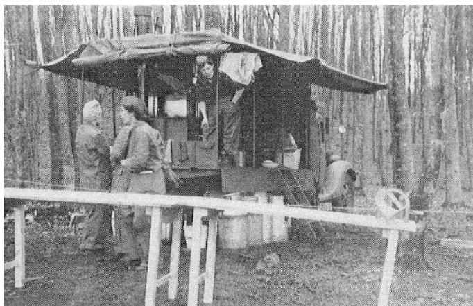
Feltkøkkenvogn og sammenklappeligt køkkenbord. Fra Kilde 1.

I Brigadens forlægninger fik lotterne en elementær uddannelse i blandt andet militær anstand. Lotterne var ikke bevæbnede, men det ansås for væsentligt, at de var i stand til at betjene pistol og maskinpistol. Som en del af uddannelsen indgik også den egentlige forplejning af mandskabet.