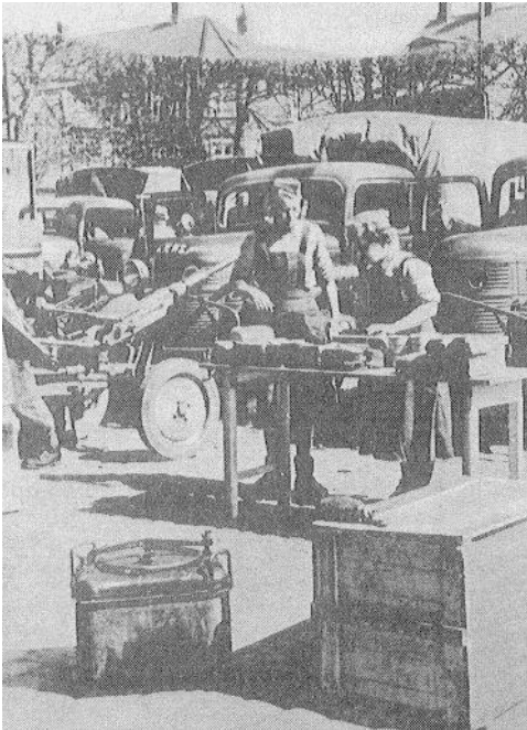
Forplejning på Axeltorv i Helsingør, om morgenen den 6. maj 1945. Fra Kilde 1.

Der kan være tale om Køkkenhold 15, der indgik i 5. (tunge) Bataljons, 2. Kompagni (Maskinkanonkompagni).