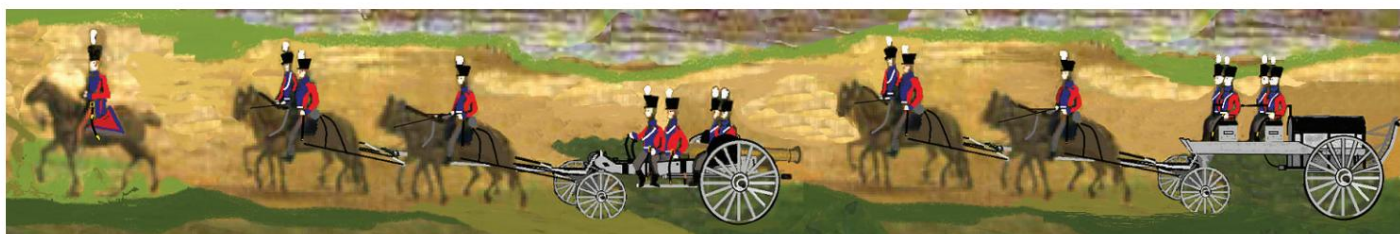
dansk 3 pdr. Besat artilleri 1808-1814.