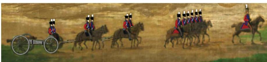
Norsk berednet artilleri 1811-1814. Der var flere skytter, der red på heste i det norske beredne artilleri end i det danske beredne artilleri.

haubitser med vogne og lim ber men beholdt de danske ammunitionsvogne, hvorpå skytterne kunne stige (Ammunitionsvogne til det beredne artilleri). Da batteriet også modtog ekstra heste, beholdt batteriet manøvreduktigheden af et "Mounted battery".