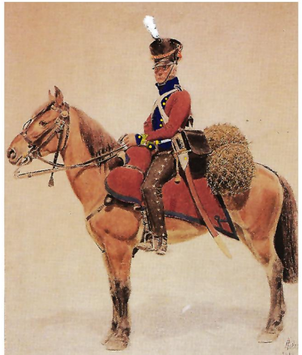
Tidligere norsk dragon ca. 1814, fra 1811 tjent som bereden artillerist. Han bærer en artillerisabel og to pistoler. På grund af mangel på et tilstrækkeligt antal artillerisabler i Norge ville mange have båret det lige sværd M 1750, men stadig ophængt i bæltet.