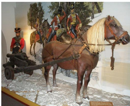
Norsk berednet artilleri 1811-1814. Der var flere skytter, der red på heste i det norske beredne artilleri end i det danske beredne artilleri.

var organiseret som de danske norske artilleribatterier. I 1811 blev det norske artilleri stærkt reformeret og 5 lette "National" 3 pdrs. virksomheder blev omdannet til "Mounted Batteries".