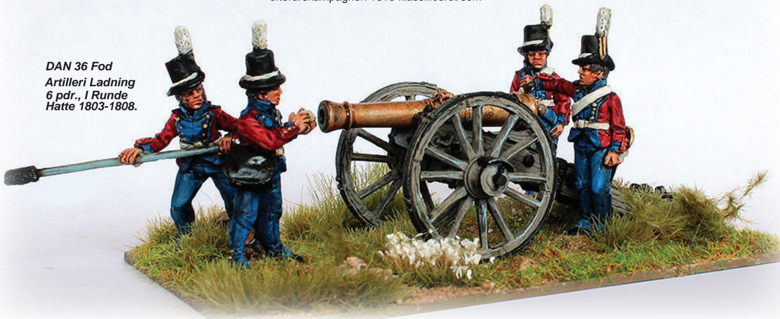
DAN 36 Fod Artilleri Ladning 6 pdr., I Runde Hatte 1803-1808.

Enhedsstørrelse og statistik for Sharp Practice 2 og Black Powder: y