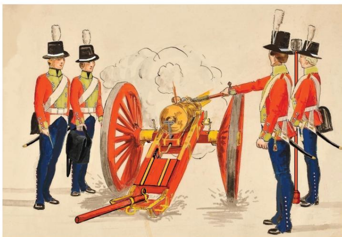
Regimental Artillery crew in action from The Danish Life Regiment – "Danske Livregiment til Fods" 1807.

1. I Norge bør hesteartillerikompagniet/batteriet omfatte 8 3 pdr. kanoner og 2 (korte) 10 pdr. haubitser.