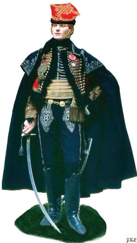
General de Brigade Charles Lallemand med sin berømte røde "polske" felthue.