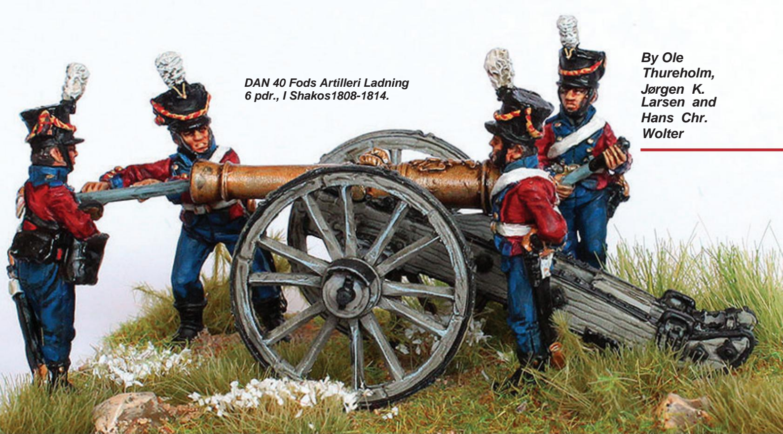
DAN 40 Fods Artilleri Ladning 6 pdr., I Shakos 1808-1814.