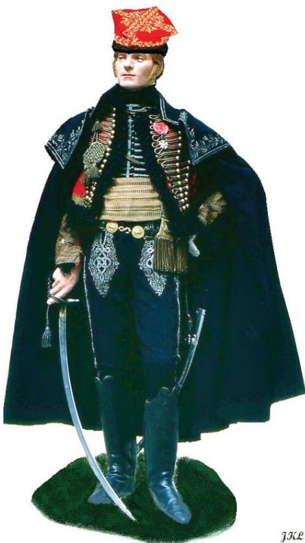
General de Brigade Charles Lalle mand mit seiner berühmten roten „polnischen“ Feldmütze.

Oberleutnant Johannes v. Ewald vom Husarenregiment. Wahrscheinlich einer der besten Offiziere im Husarenregiment. 1809 in Stralsund und 1813 erneut in Gadebusch ausgezeichnet.