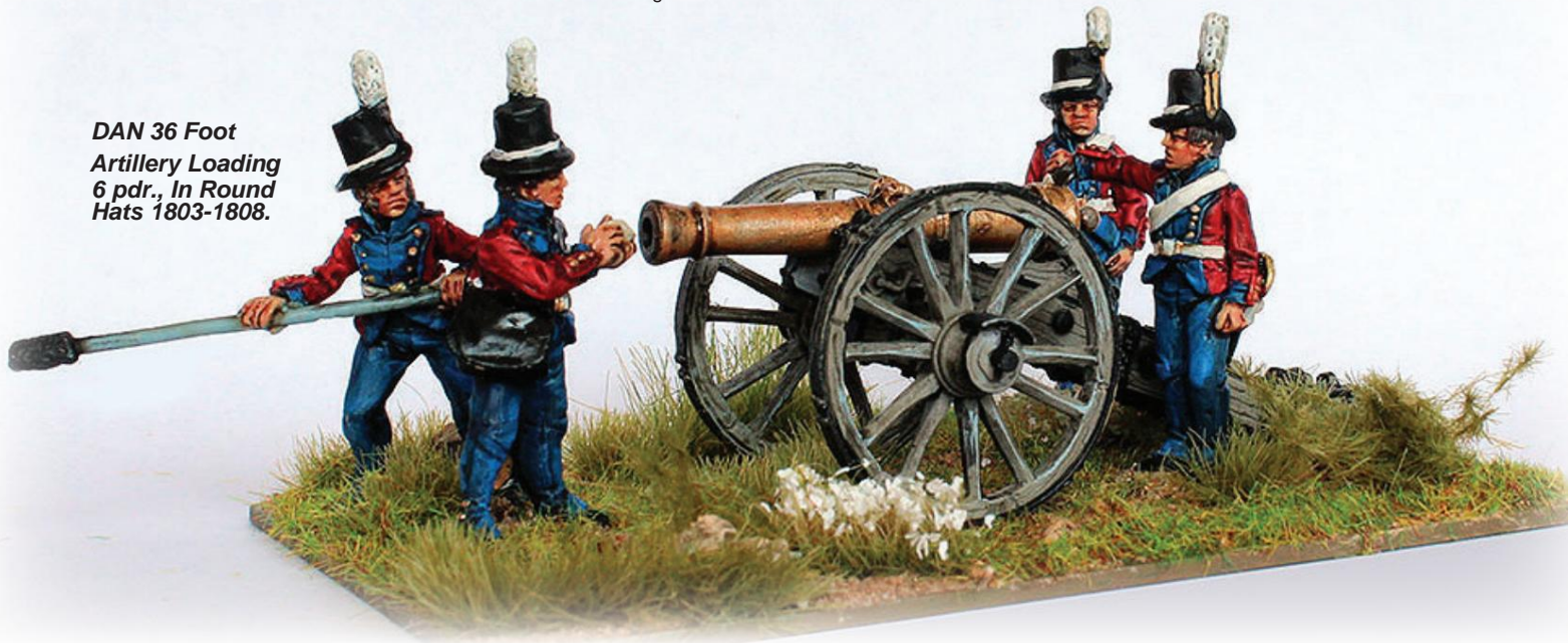
DAN 36 Foot Artillery Loading 6 pdr., In Round Hats 1803-1808.

Einheitengröße und Werte für Sharp Practice 2 und Black Powder: \ddot{y}