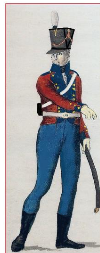
Berittener Artillerie-Schütze 1808.