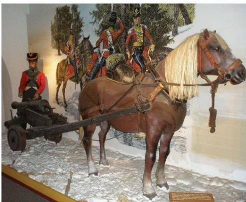
Norwegische berittene Artillerie 1811-1814. In der norwegischen berittenen Artillerie gab es mehr Kanoniere auf Pferden als in der dänischen berittenen Artillerie.

Der norwegische 1 pdr. „Amusette“-Batterien werden durch 2 Kanonen in General de Brigade und durch 1 Kanone in Black Powder repräsentiert. Verwenden Sie eine einzelne Waffe in Sharp Practice 2, um einen Abschnitt von zwei „Amusettes“ darzustellen. y