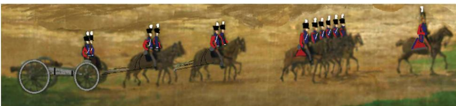
Norwegische berittene Artillerie 1811-1814. In der norwegischen berittenen Artillerie gab es mehr Kanoniere auf Pferden als in der dänischen berittenen Artillerie.

Haubitzen mit Lafetten und Prothesen, behielten aber die dänischen Munitionswagen, auf die die Kanoniere aufsteigen konnten (Munitionswagen für die berittene Artillerie). Da die Batterie auch zusätzliche Pferde erhielt, behielt die Batterie die Manövriefähigkeit einer „Angebauten Batterie“.