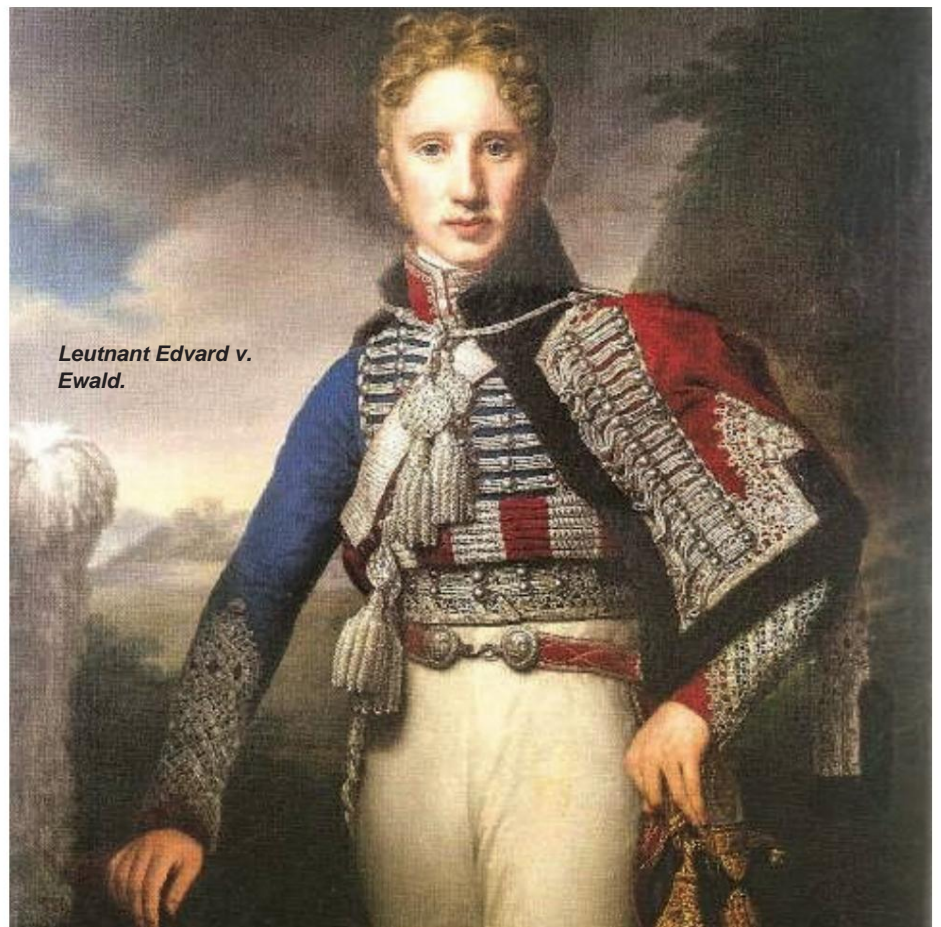
Leutnant Edvard v. Ewald.

Leutnant Edvard v. Ewald aus dem Husaren-Regiment. An der Spitze einer Husarenabteilung schlug er am 18.