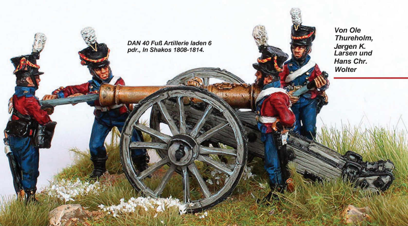
DAN 40 Fuß Artillerie laden 6 pdr., In Shakos 1808-1814.