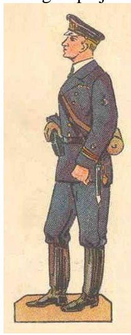
Kvartermester af 3 grad.