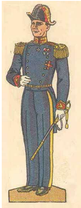
Admiral (Kronprins Frederik sener den IX )