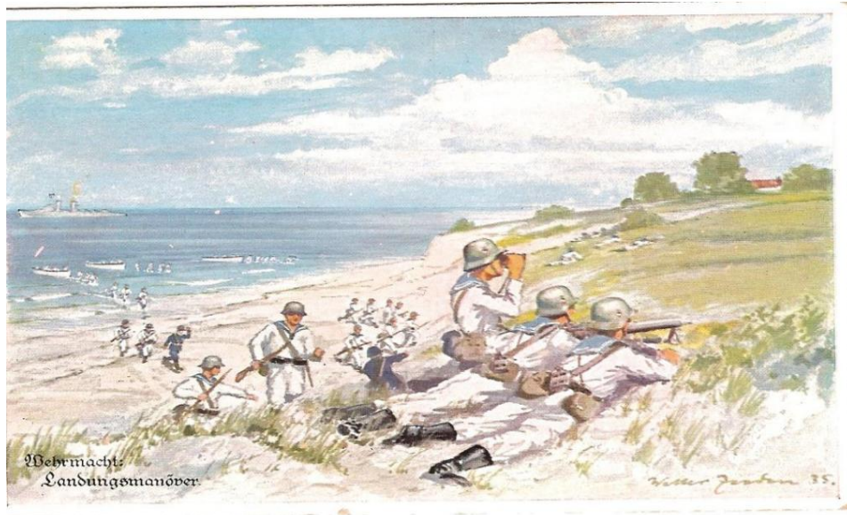
Landeübungen vor dem Krieg, hier in weißen Wendemänteln gekleidet, mit Ausrüstung. (Deutsche Ansichtskarte eigene Sammlung)