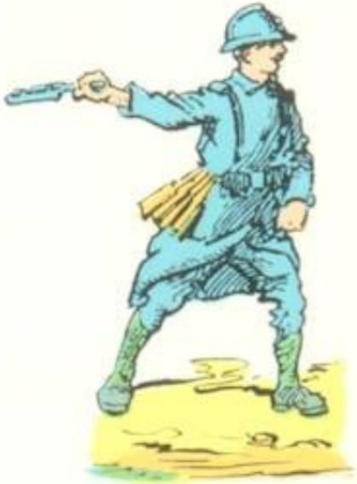
Pétard auf Schläger montiert.

Kurz vor dem Ersten Weltkrieg entwickelte Aasen eine mächtige Antipersonenmine, den automatischen Soldaten, der als Abschreckungswaffe gedacht war. Diese Erfindung begeisterte das französische Militär, ging aber erst nach dem Krieg in Serie. Während des Ersten Weltkriegs wurde Aasen die Verantwortung für die Produktion von Handgranaten für die französische Armee übertragen. Er hatte während des Krieges 13 Fabriken und 13.000 Arbeiter in Betrieb.