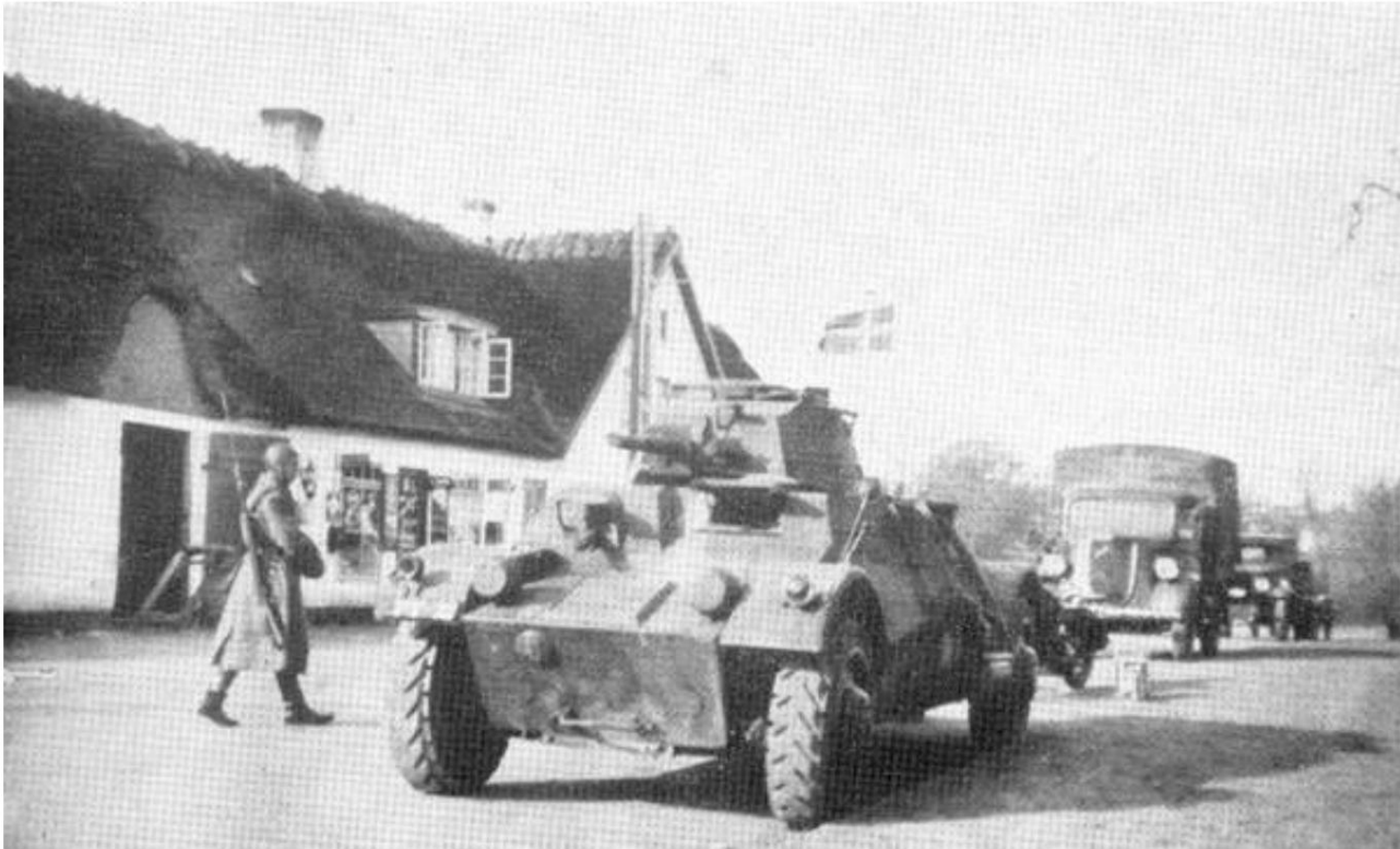
Des parties du Faksegruppe du Guardhusar Regiment le 9 avril 1940. De Dragonvisen.

À l'avant se trouve une voiture blindée Landsverk Lynx (PV10), suivie d'une moto, d'une Opel Blitz et d'un camion Ford. Le hussard (qui fait partie de l'équipage de la moto) porte, entre autres, capot moteur 1938 et porte sa carabine de cavalier 1889, avec la baïonnette du berger, sur l'épaule droite.