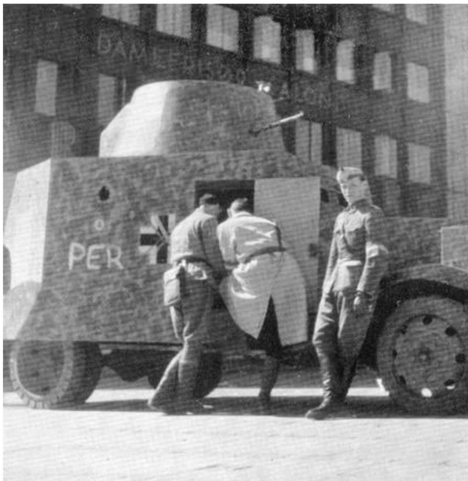
Voiture blindée expérimentale 1 ou 2 en peinture allemande, photographiée le 8 mai 1945. De Source 1.

Compte tenu de la délimitation de la période, il n'est pas question ici de décrire la situation des régiments de cavalerie pendant l'Occupation, y compris les escarmouches entre unités allemandes et danoises le 29 août 1943.