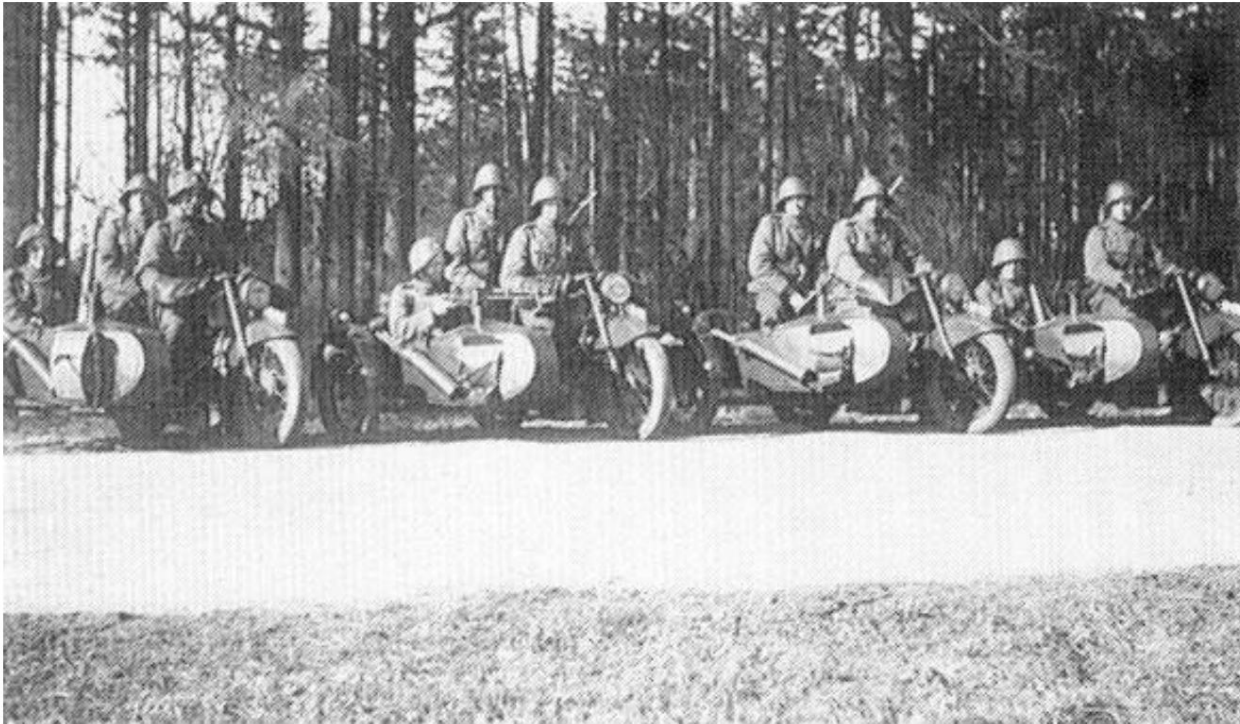
Groupe de motocyclistes du régiment de Gardehusar. De Source 3.