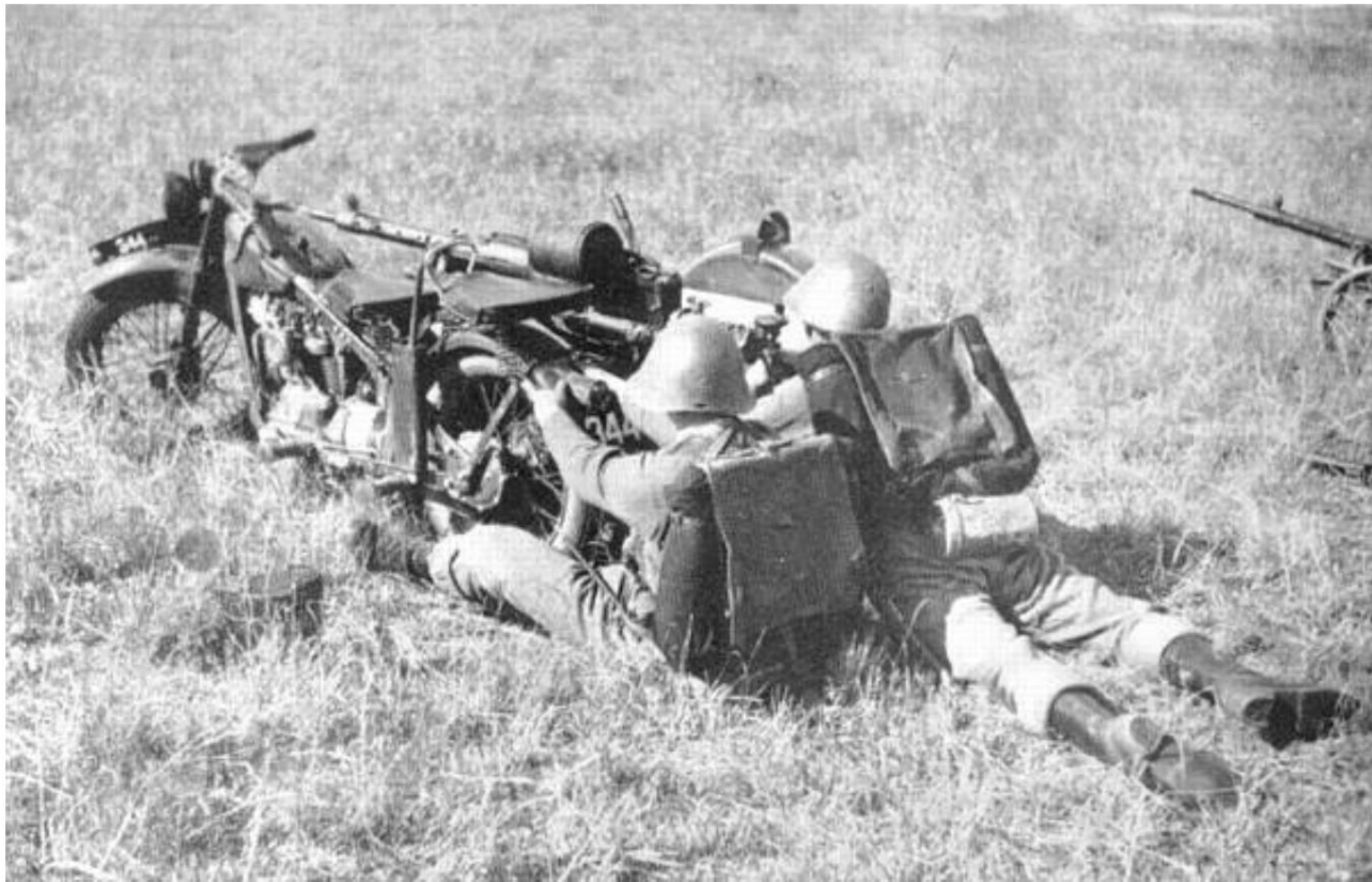
Mitrailleuse 20 mm M.1938 - Prête à tirer, avec le support sur la moto 2).

Sur commande Véhicules blindés en ce moment ! Prêt à tirer ! l'assistant conduit la moto à l'endroit d'où il est préférable de tirer (généralement du côté gauche de la route), la positionne de manière à ce que la direction du côté rugueux soit donnée, arrête le moteur et freine fermement le guidon. Il soutient alors le side-car lors de la prise de vue en tenant l'écran (support de lumière) et en appuyant sous la roue avec son pied droit... Ainsi, d'après Source 1 et sur la photo, la situation est clairement démontrée.