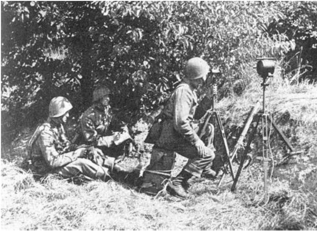
Équipe de signalisation avec station de signalisation.