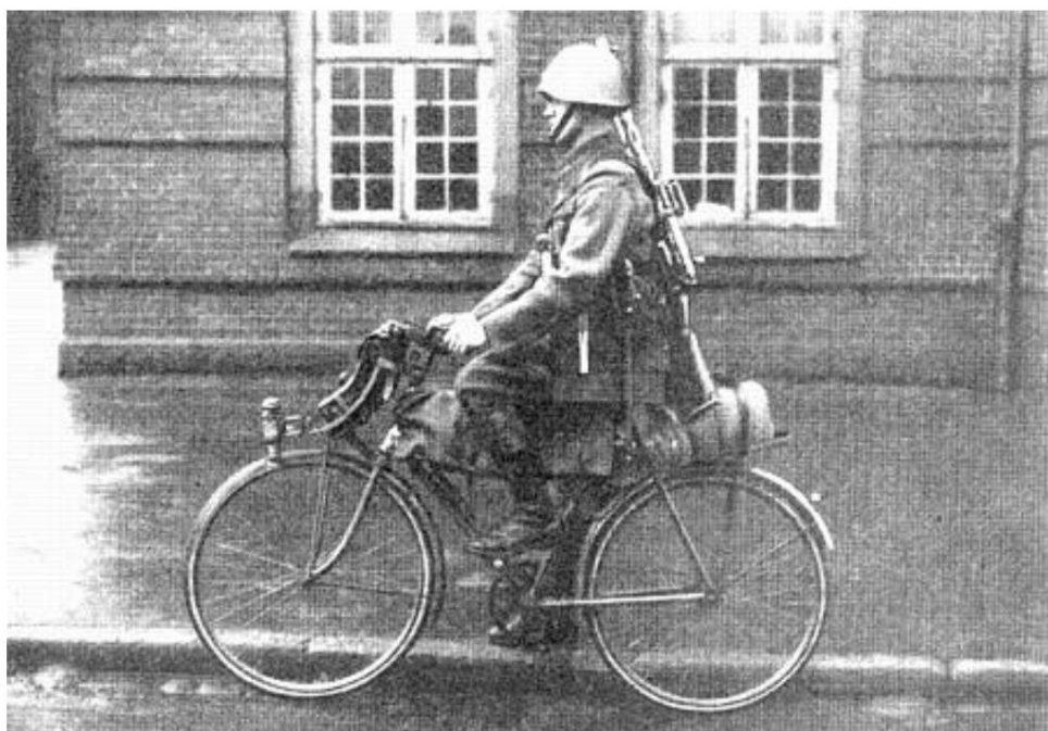
Mitrailleur de recul, Guard Hussar Regiment. De Source 2.

L'escadron cycliste est organisé comme suit :