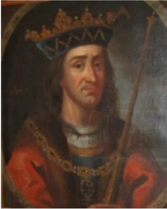
König Hans (geb. 1455, 1481 - 1513)

Viele haben wohl in der Schule gelernt, „dass die Flotte aus der Zeit von König Hans stammt“. Das stimmt auch. Aber vorher gab es viele verschiedene Initiativen, um eine Art "Seemacht" in Bezug auf die königliche Macht zu etablieren. In den Jahren zuvor hatte der König seine eigenen Schiffe, die manchmal für den Krieg ausgerüstet waren. Er konnte Kaufleute, Reeder (Schiffseigner) oder Schiffer anstellen, die Aufgaben für ihn erledigten, und er konnte Kaperbriefe an Schiffer ausstellen. Mit einem solchen Brief wurden sie zu einer Art staatlich autorisierten Piraten in den Gewässern, in denen der König seine Macht demonstrieren wollte.