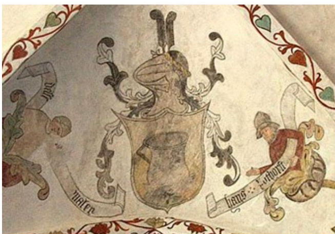
Pothorst ist zusammen mit seinem Wappen auf einem Fresko in Sankt Maria Kirke in Helsingør abgebildet.

Dies waren erfahrene und äußerst zähe Leute, die es gewohnt waren, in Gewässern mit Feinden und Piraten zu operieren.