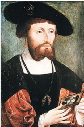
Christian der Zweite (geb. 1481, 1513 – 1523)

"Die Strömungen in Unseren Ländern sind frei, und Wir haben nicht die Absicht, sie zum Nachteil des Königreichs und zum Nutzen Lübecks für eine Seefahrernation zu schließen."