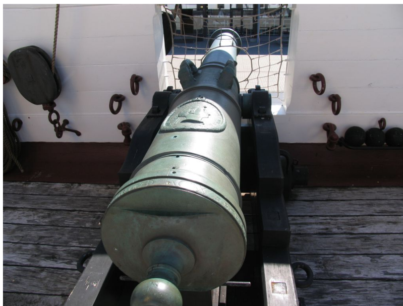
12-pundig dækskanon på Fregatten Jylland

Nr. 11 - Nr. 13 - Nr. 29 - Nr. 30 - Nr. 31 - Nr. 33 - Nr. 39 - Nr. 40 og Nr. 58