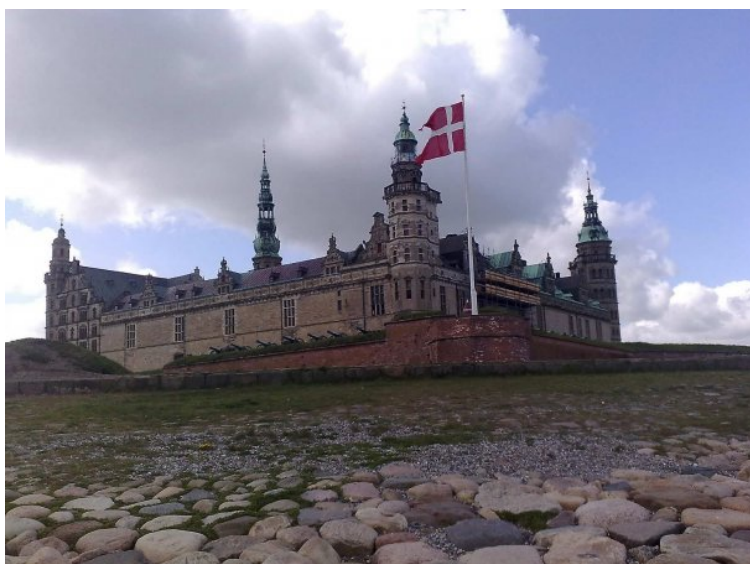
Flagbastionen set fra Øresund

Flagbastionen var det vigtigste fæstningsværk mod søsiden og den bastion, hvorfra Kronborg længst har kunnet virke som sundets vogter og Danmarks grænsfæstning mod nordøst.