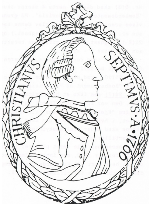
Er dette i virkeligheden Frederik V ?

Nr. 9 bærer et specielt brystbillede af Kong Christian VII. Det kan skyldes , at denne kanon hører til de to først støbte, og at billedet der for faktisk er af Kong Frederik V, der døde 14. januar 1766 medens de to første kanoner var under formning på Frederiksværk.