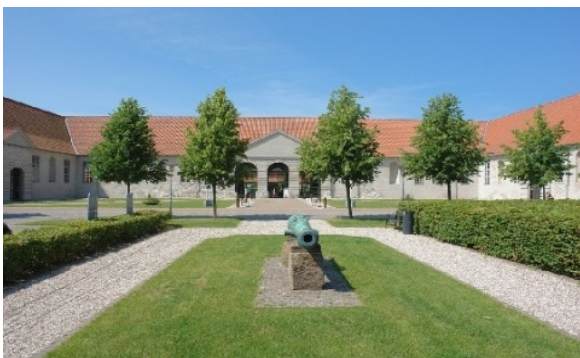
Gjethuset Frederiksværk

Efter flere sammenlægninger og nedlægninger varetages opgaven med at betjene Kronborgs kanoner af Danske Artilleriregiment.