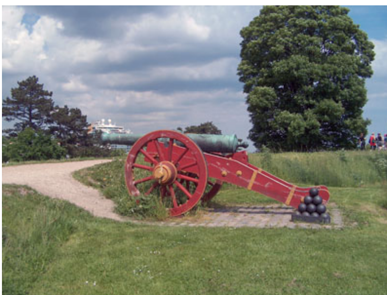
12-pundig kanon på Kastellet

Det Drejer sig om løbenummer Nr. 2, Nr. 3 og Nr. 42 (efter opriflingen)