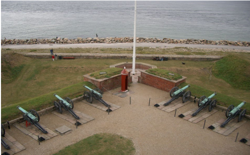
Kronborg Flagbastion set oppe fra Dronningetårnet

De fleste besøgende på Kronborg, Frederik II's, Christian IV's og Hamlets prægtige renæssance slot, ofrer vel kun en flygtig tanke på, at Kronborg også er en fordums fæstning, endda en af landets stærkeste.