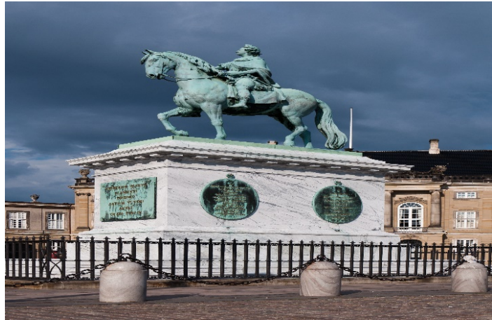
Frederik V Rytterstatue - Amalienborg Slotsplads

Årsagen til at det blev Gjethuset i Frederiksværk som fik opgaven med at støbe kanonerne skal findes i, at Gjethuset i København på det tidspunkt var travlt optagede med at støbe den store rytterstatue af Kong Frederik V som i dag står midt på Amalienborg Slotsplads.