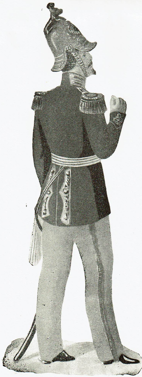
General af rytteriet 1849 General of cavalry General der cavallerie