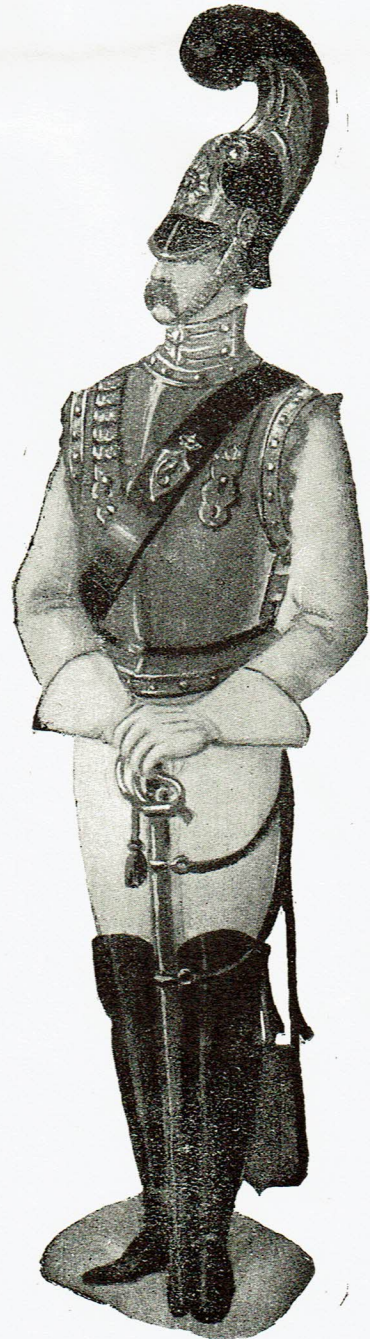
Menig af Livgardeeskadronen 1842 Trooper of the Horseguard Gemeiner der Leibgardeschwarron