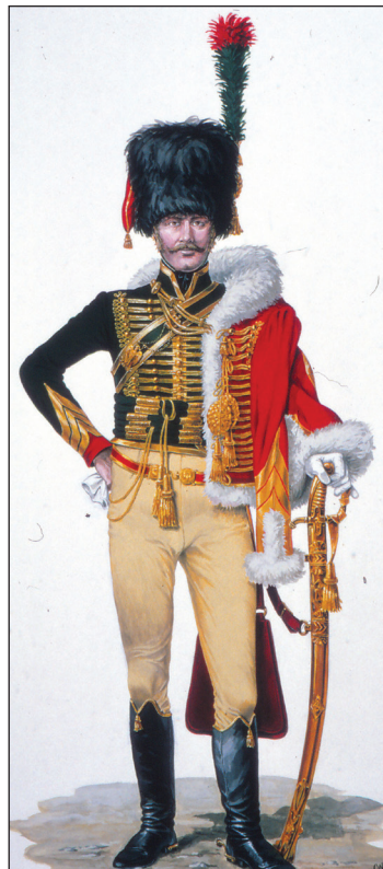
Officer, Chasseurs à Cheval de la Garde Impériale.