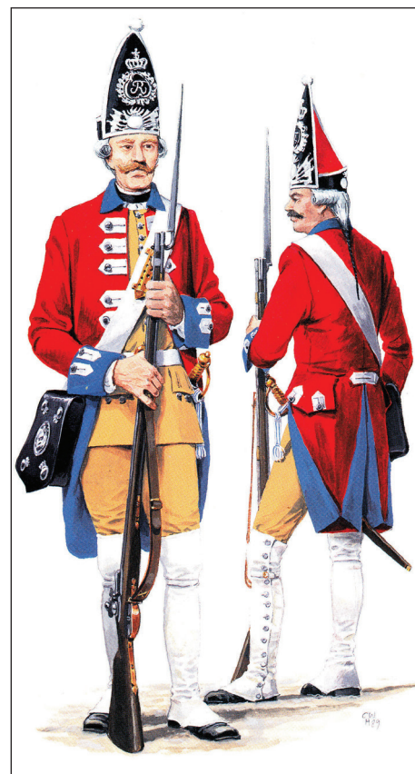
Grenaderkorpset, menig, 1761.