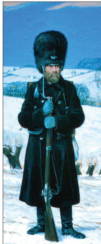
Menig ved Livgarden med sort lædertøj ved Dybbøl 1864.