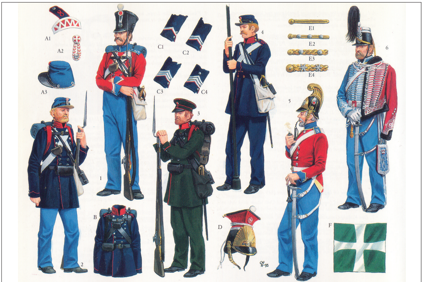
Danske soldater under trærs-krigen.