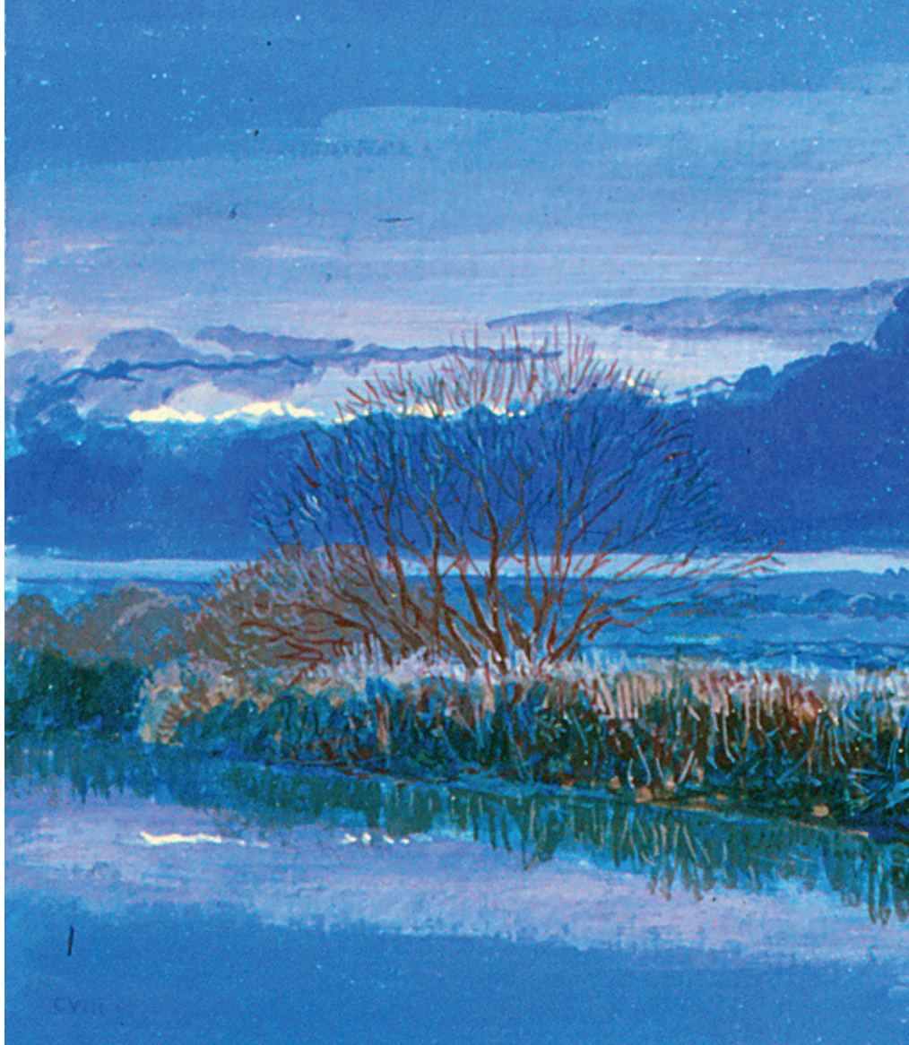
Danske forposter ved Lindauer å aftenen før slaget ved Sehested den 10.12.1813.