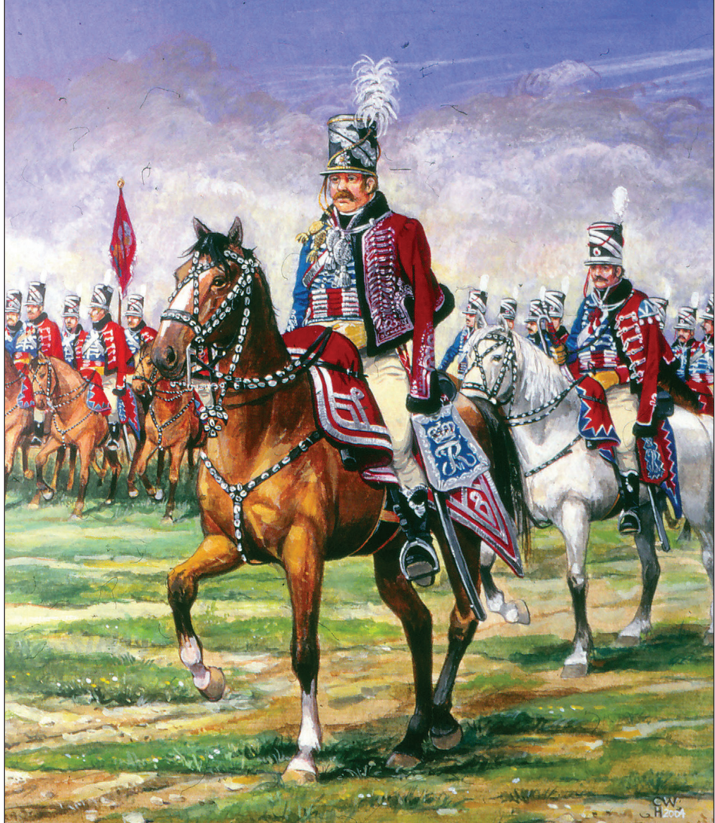
Danske husarer ved Stralsund 1809.