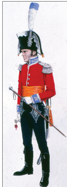
Officer med stok, Livgarden til Fods, 1809.