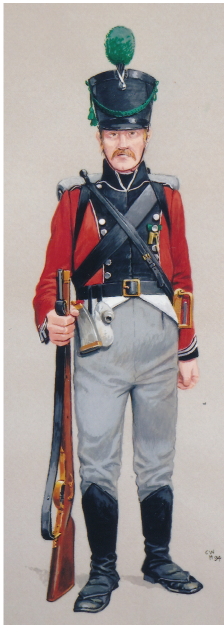
Jæger, 1813, set forfra og bagfra.