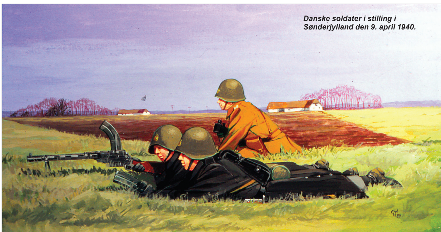
Danske soldater i stilling i Sønderjylland den 9. april 1940.