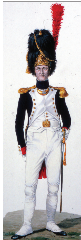
Officer, Grenader Garde.