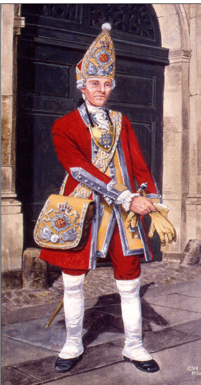
Grenaderofficer i Livgarden på Fr. 5.'s tid.