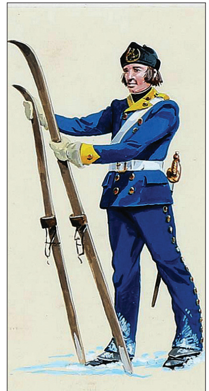
Skiløberkorpsset, menig, 1709.