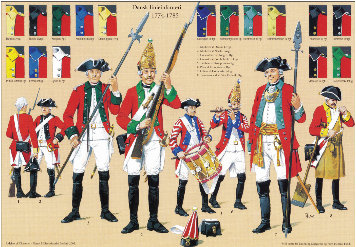
Dansk Linjeinfanteri 1774-1785. Uniformsplanche vedlagt chakotens september-udgave 2002.