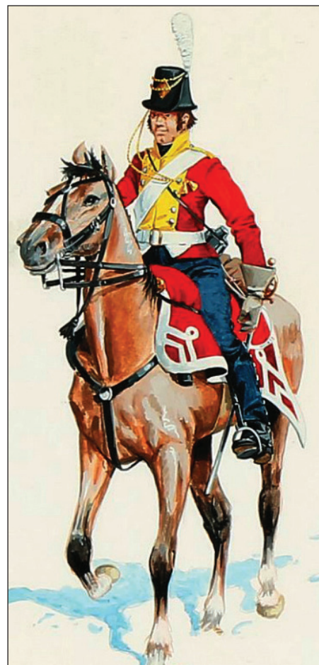
Smålenke Dragon regiment, 1808.

i 1807, de indledende slag i forbindelse med Napoleons indtog i Rusland i 1812, Slaget på Anholt i 1811, slagene i Den Store Nordiske Krig 1701-1721, slagene i forbindelse med auxiliærkorpsets tilbagetrækning fra Nordtyskland og slaget ved Sehested i 1813, 3års-krigen, 1864 og kampene i forbindelse med den 9. april 1940, for nu blot at nævne de mest markante. Hele sit livsværk i form af hans store samling af plancher og billeder har han stillet til rådighed for