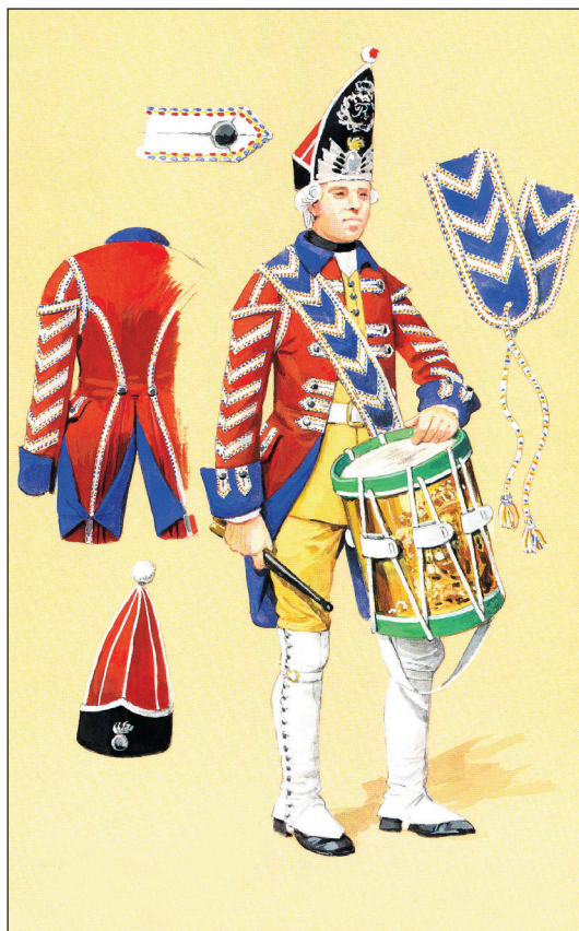
Tambur, Grenaderkorpset, 1760.