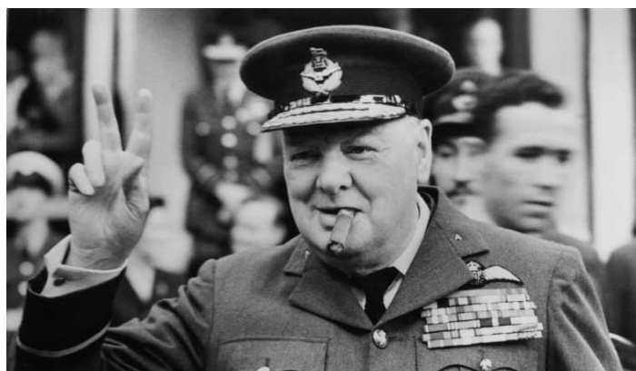
Winston Churchill var kendt for sine storslåede taler, der var et vigtigt middel til at puste håb og kampgejst ind i den britiske befolkning.