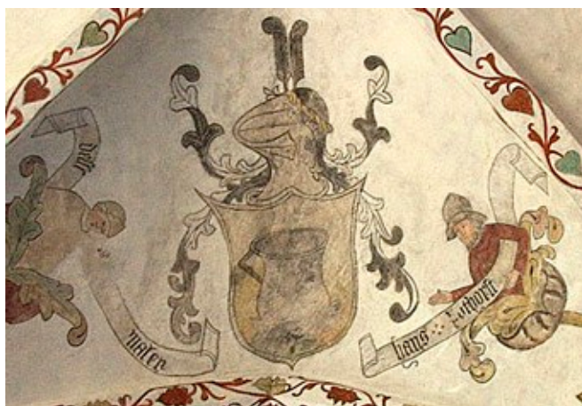
Pothorst er afbilledet sammen med sit våbenskjold, på et kalkmaleri i Sankt Maria Kirke i Helsingør.

Der var tale om erfarne og særdeles hårdføre folk, som var vant til at operere i farvande med fjender og sørøvere.