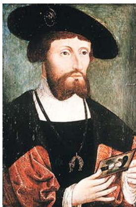
Christian den Anden (f. 1481, 1513 – 1523)

”strømmene i Vore lande er fri, og Vi er ikke til sinds, til skade for riget og til fordel for Lübeck at lukke dem for nogen søfarende nation.”