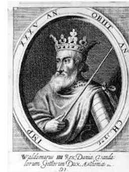
Valdemar Atterdag 1320-1375

Denne Flåde erobrede nogle år senere Gotland, hvorfor den svenske konge Magnus Eriksson måtte anmode Hansaen [2] om hjælp mod danskerne.