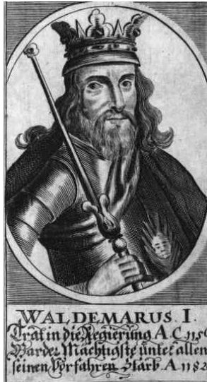
Valdemar den store 1131-1182

Ledingssystemet blev ændret under Valdemar den Store og biskop Absalon, som havde brug for en flåde hvert forår, når venderne skulle bekæmpes. Det blev så lavet om til en skat, som skulle betales af dem, der ikke stillede med skibe og mandskab.