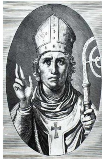
Biskop Absalon 1128-1201

Senere kunne Valdemar Sejr samle en stor flåde, som i 1219 medbragte så store styrker, at den nordlige del af Estland kunne erobres.