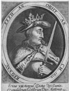
Erik Menved 1274-1319

Ledingssystemet døde ud omkring år 1300.