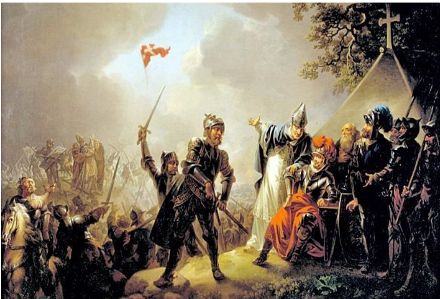
Dannebrog falder ned fra himlen Slaget ved Lyndanisse 15. juni 1219

Senere kunne Valdemar Sejr samle en stor flåde, som i 1219 medbragte så store styrker, at den nordlige del af Estland kunne erobres.