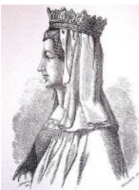
Margrethe d. I 1353-1412

I 1384 er det dronning Margrethe den Første som lover at komme Hansaen til hjælp mod sørøvere og Danmark stiller med ni skibe.