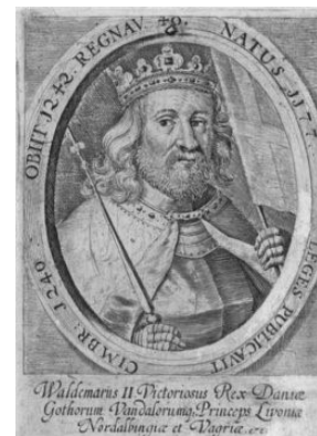
Valdemar Sejr 1170-1241