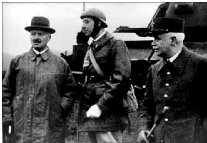
Oberst de Gaulle ved præsentation af sit kampvognsregiment for den franske forsvarsminister.