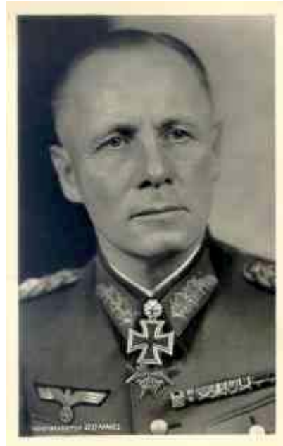
Generalmajor Erwin Rommel Chef for 7. Panzer-Division Maj 1940