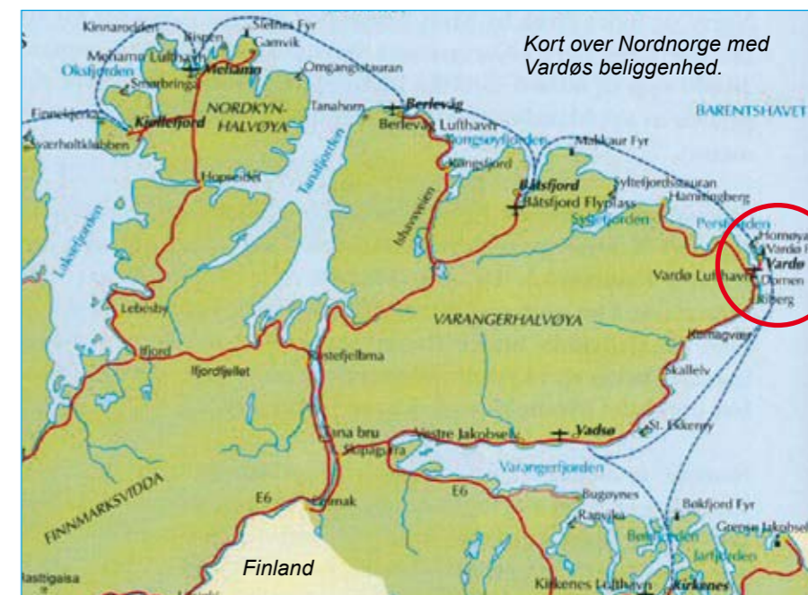
Kort over Nordnorge med Vardøs beliggenhed.

den måde, de udførte fangst & tørring af fisk, og der var en rædselsfuld stank af fisk & tran, som gjorde det uudholdeligt at opholde sig her.