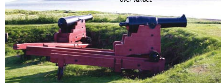
Fæstningskanoner eller voldkanoner, som nordmændene kalder dem i raperter på slæder med frit skud over vandet.

Efter en langvarig krig 1572 - 95 lykkedes det Sverige i 1581 at erobre de