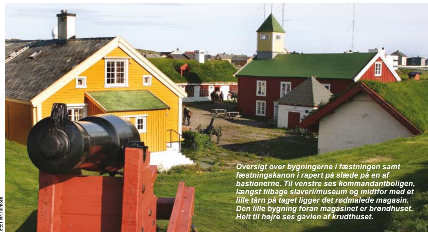
Oversigt over bygningerne i fæstningen samt fæstningskanon i rapert på slæde på en af bastionerne. Til venstre ses kommandantboligen, længst tilbage slaveri/museum og midtfor med et lille tårn på taget ligger det rødmaledede magasin. Den lille bygning foran magasinet er brøndhuset. Helt til højre ses gavlen af krudthuset.

Slagtebæk Dybbøl er en medrivende, dokumentarisk beretning om Danmarks krig mod to tyske stormagter, Prejsen og Østrig, i 1864 - om vejen til Dybbøl og om det politiske spil i København og Berlin under krigen. Men først og fremmest er det en fortælling om de soldater, officerer, feltlæger og krigskorrespondenter, der oplevede krigen og det blodige slag den 18. april 1864. Slagtebæk Dybbøl var soldaternes eget navn for fronten.