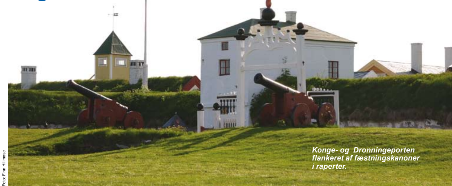
Konge- og Dronningeporten flankeret af fæstningskanoner i raperter.