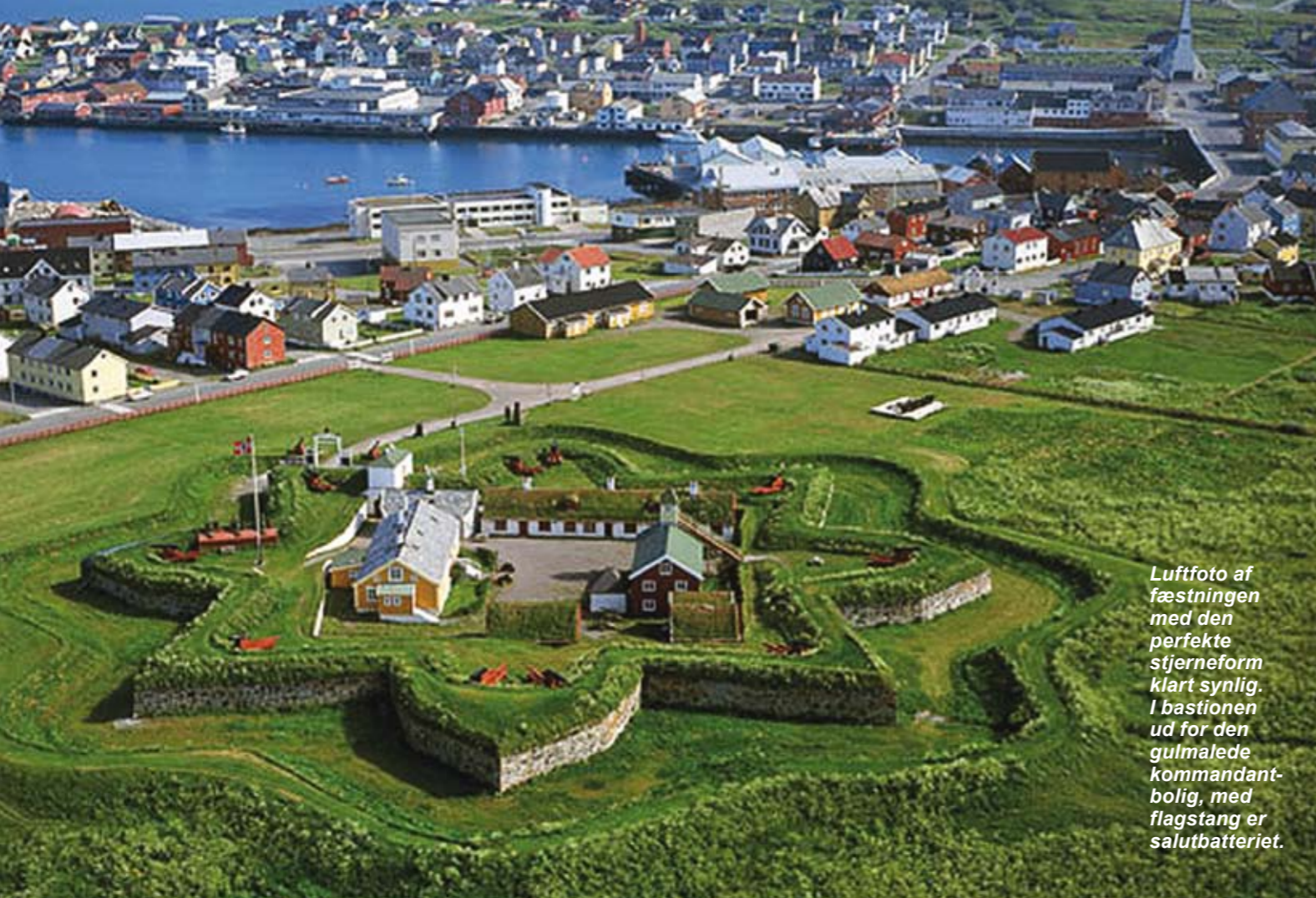
Luffoto af fæstningen med den perfekte stjerneform klart synlig. I bastionen ud for den gulmalede kommandantbolig, med flagstang er salutbatteriet.