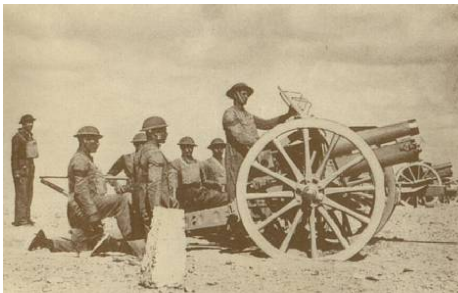
Engelsk 4,5 tommers haubits med ægyptisk besætning 2 ). Det middeltunge batteri er måske det her viste haubitsbatteri.