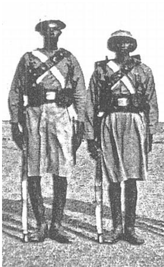
Uidentificerede afrikanske soldater, måske fra Sudan Defence Force.

Efter en intensiv uddannelse blev bataljonen, sammen med en bataljon af etiopiske frivillige (2 nd Ethiopians) indsat i befrielsen af Etiopien, som en del af den såkaldte Gideon Force, der var under kommando af den excentriske engelske general Orde Charles Wingate 13 , der måske er bedst kendt som chef for Chindit enhederne i Sydøstasien.