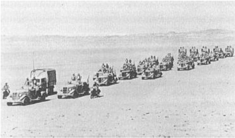
"C" Eskadron, 8 th Royal Irish Hussars, Ægypten, 1936

Regimentet deltog i troppeforsøg med dette maskingevær, der senere blev valgt fra til fordel for den lette Bren Gun. Vickers-Berthier maskingeværet blev dog indført i den indiske hær.