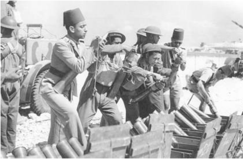
Ægyptiske luftværnsartillerister fra 1. Luftværnsregiment 8 ).

Ikke alle de nævnte pjecer fremgår af oversigten, men ukendt antal var placeret langs forbindelseslinjerne i Ægypten.