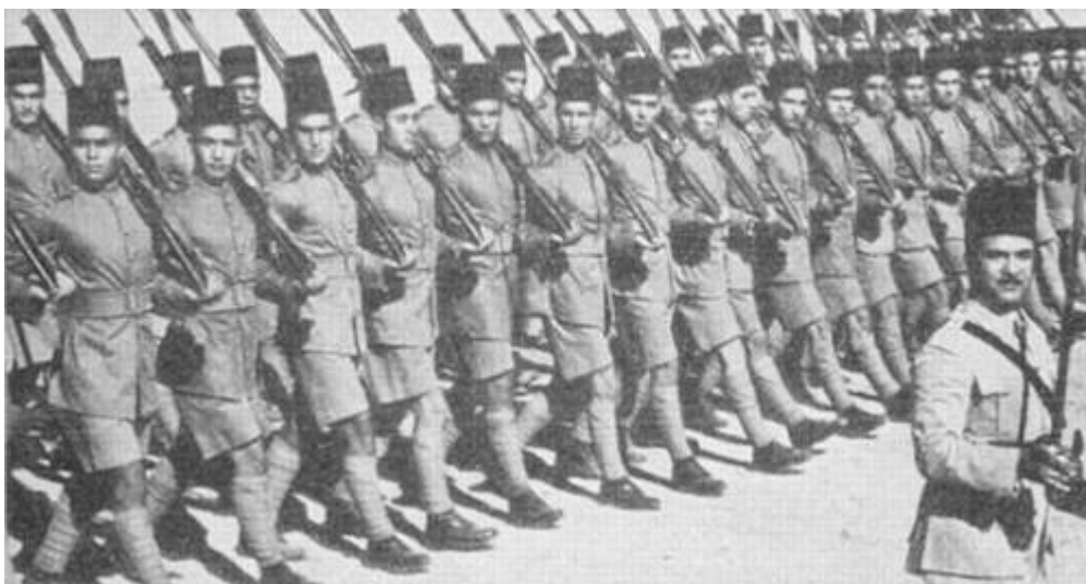
Ægyptisk infanteri, ca. 1939 1 .

I midten af 1930'erne omfattede den ægyptiske hær: