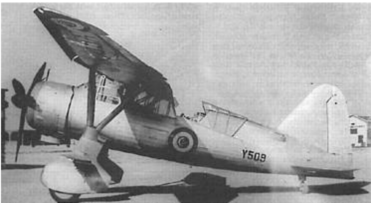
Westland Lysander fra Det ægyptiske Flyvevåbens 1. Eskadrille, 1939. Fra Kilde 8.

1. Eskadrilles 18 maskiner var fra maj 1939 organiseret i to afdelinger ( flights ), der hver havde 5 aktive maskiner og 4 i reserve.