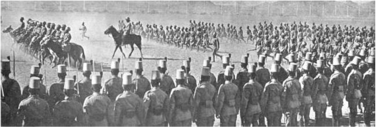
Ægyptisk infanteri og rytteri, ca. 1914.