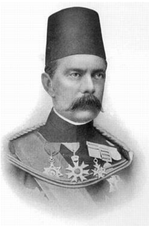
Horatio Kitchener, Sirdar i den ægyptiske hær, 1882-1899 7 .

General Wingate 5 var fra 1899 til 1916 øverstkommanderende for den ægyptiske hær, Sirdar, og generalguvernør over Sudan.