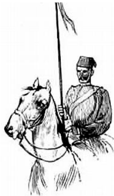
Ægyptisk lansener. Fra en vignet gengivet i Illustrated London News, 3. juni 1882, fundet på Internettet.