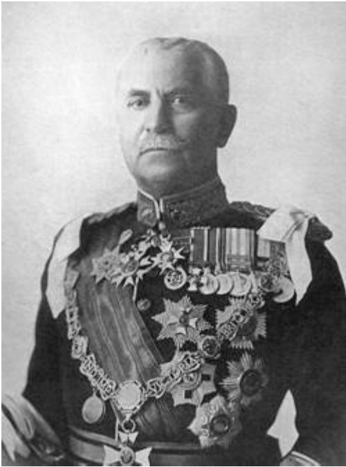
General Sir F.R. Wingate. Fra Kilde 1.

General Wingate 5 var fra 1899 til 1916 øverstkommanderende for den ægyptiske hær, Sirdar, og generalguvernør over Sudan.