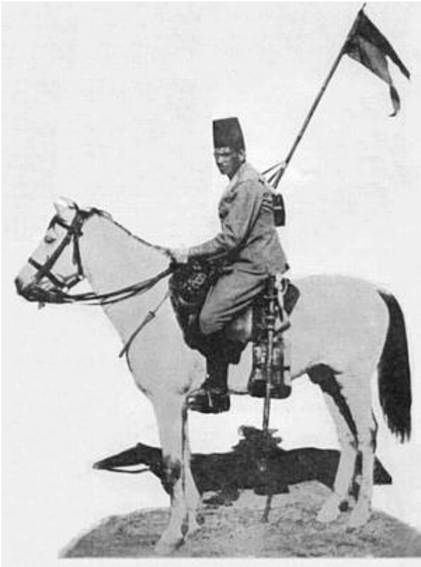
Ægyptisk lansener, ca. 1914.