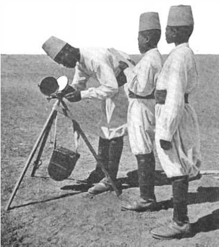
Sudanesiske soldater med heliograf. Fra Kilde 1.