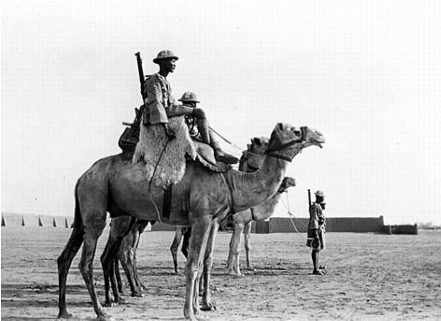
En patrulje fra det ægyptiske kamelkorps, ca. 1900.

Hæren talte 18.000 mand. Der var en værnepligtstid på tre år, men da hæren ikke var større, var det kunne man relativt let undgå at blive indkaldt, eller lade sig repræsentere ved stedfortræder. Sudanesiske borgere kunne melde sig frivilligt til hæren, på langtidskontrakt.