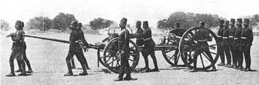
Kanoneksercits ved det ægyptiske artilleri, ca. 1900. Fra Kilde 3.

Kamelkorpset var, under Første Verdenskrig, udrustet med Martini-Henry geværer.