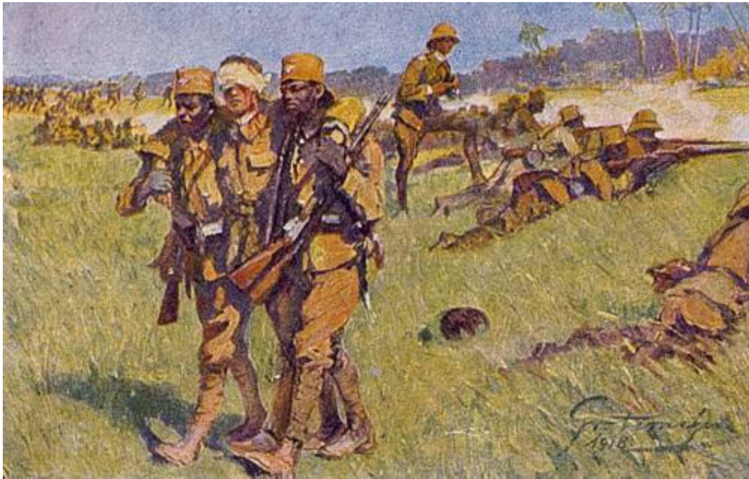
Askaritreue in Deutsch-Ostafrika, tegnet af Fritz Grottemeyer, 1918. Fra et nogenlunde samtidigt tysk postkort.

I oprindelige tyske kilder om askarier nævnes ordet trofasthed næsten pr. automatik sammen med ordet askari. Nutidige kilder anlægger ofte et næsten modsat synspunkt, og fokuserer på europæernes undertrykkelse af de indfødte.