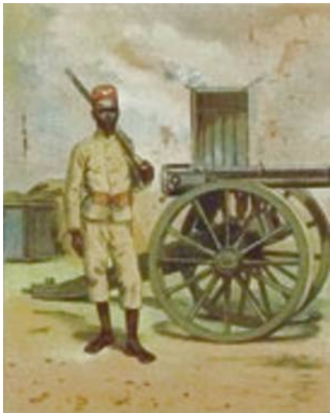
Ein Soldat der Schutztruppe als Posten an einer Revolverkanone.