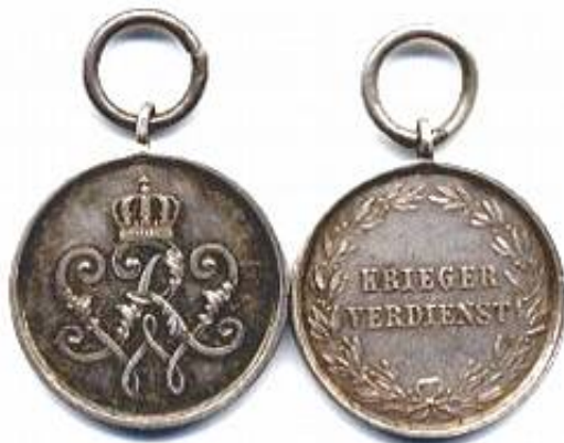
Deutsche Krieger-Verdienstmedaille, 2. Klasse, Silber.

Jeg er ikke klar over, hvor stor medaljen rent faktisk er, men guvernøren i Tysk Østafrika, Hermann von Wissmann, udbad sig efterfølgende medaljer af en betydeligt større størrelse. En del af de askarier, der var hvervet i Sudan, var tildelt forskellige engelske (og ægyptiske) udmærkelser, som de havde modtaget for deres indsats i ægyptisk og senere engelsk tjeneste, og disse veteraner var ikke imponerede over de små tyske medaljer.